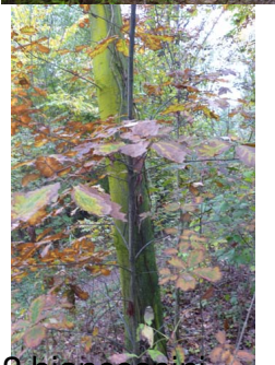
2 biancospini ...