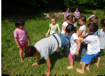
Il bambino che non si muove per gli occhi però ...