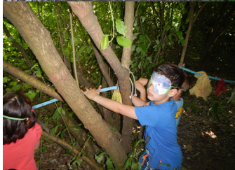
Il bambino che non si muove per gli occhi però ...