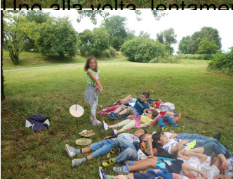
What are the conclusions?