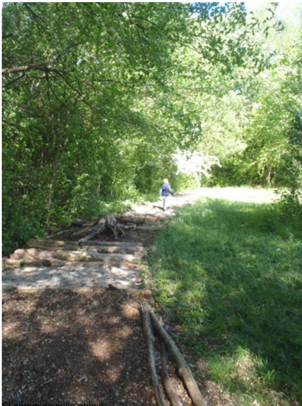
Si cammina sulla ghiaia...