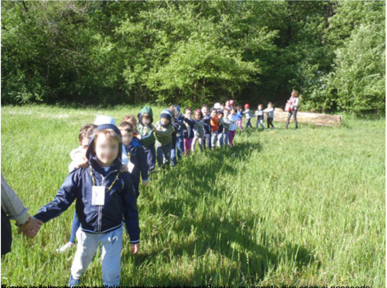
È ora di iniziare il gioco che vi ho preparato? vista...mi sapete dire cosa si nasconde