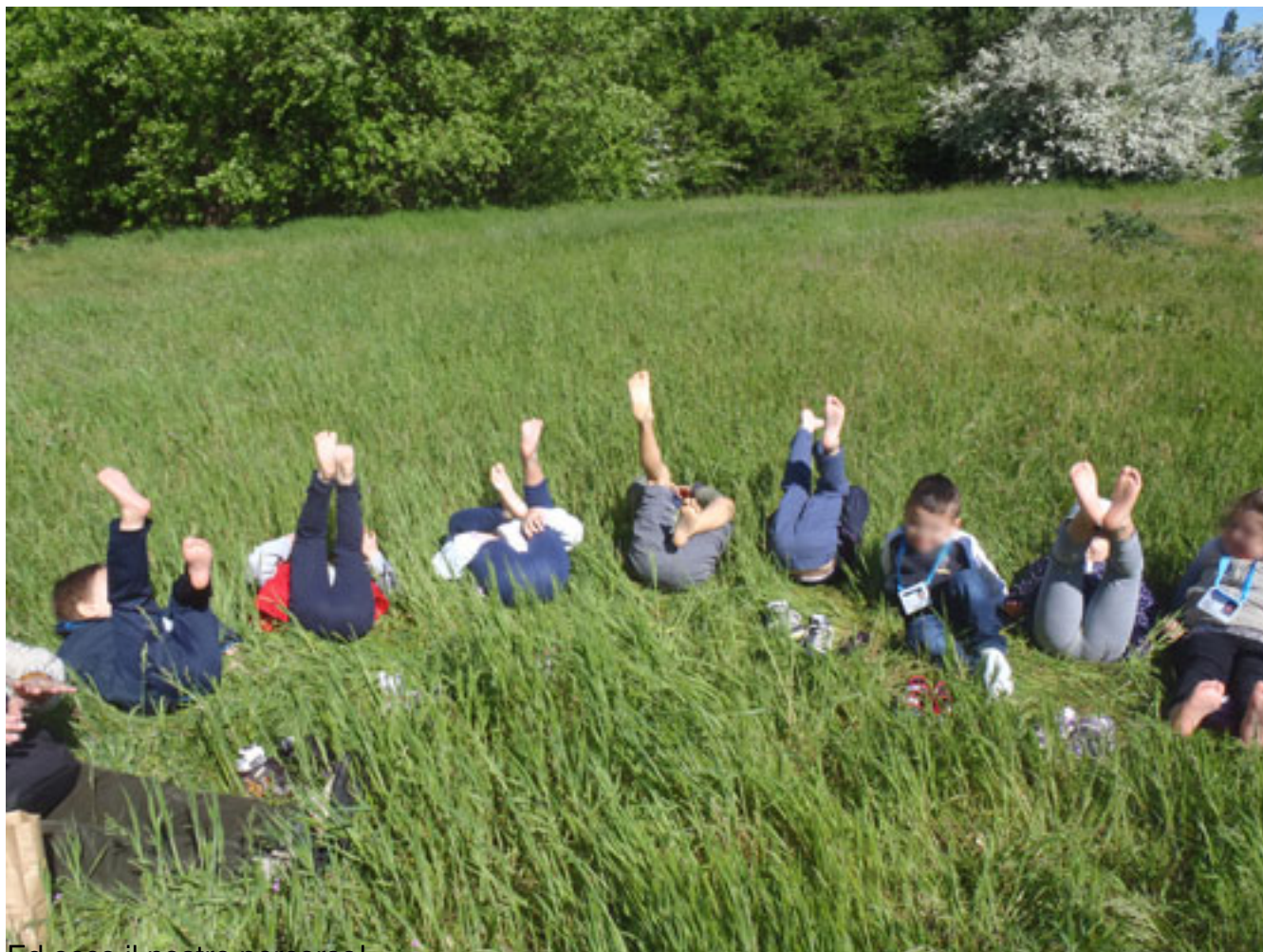
Ed ecco il nostro percorso!