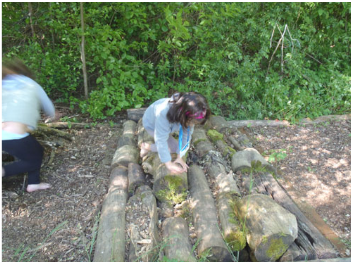
Finestra di un'attività in cui i bambini esplorano la natura e la vita delle piante e degli animali in un ambiente naturale.