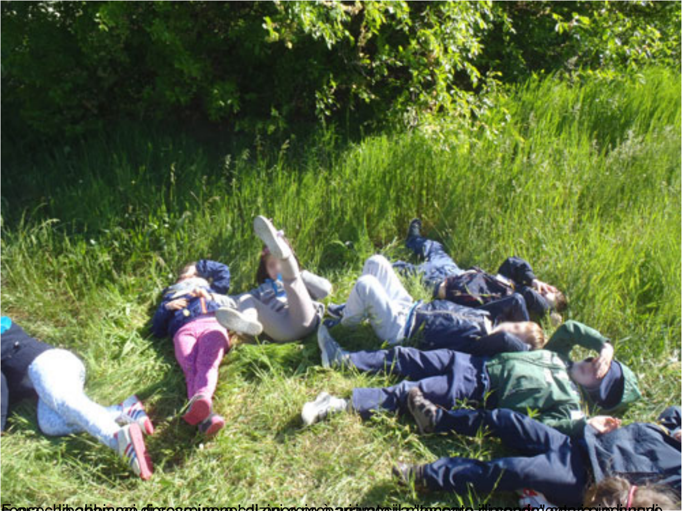
Se non che abbiamo di presapire per calze in egie è pariva a cila m'oreate di spedi' e da repia di noò...