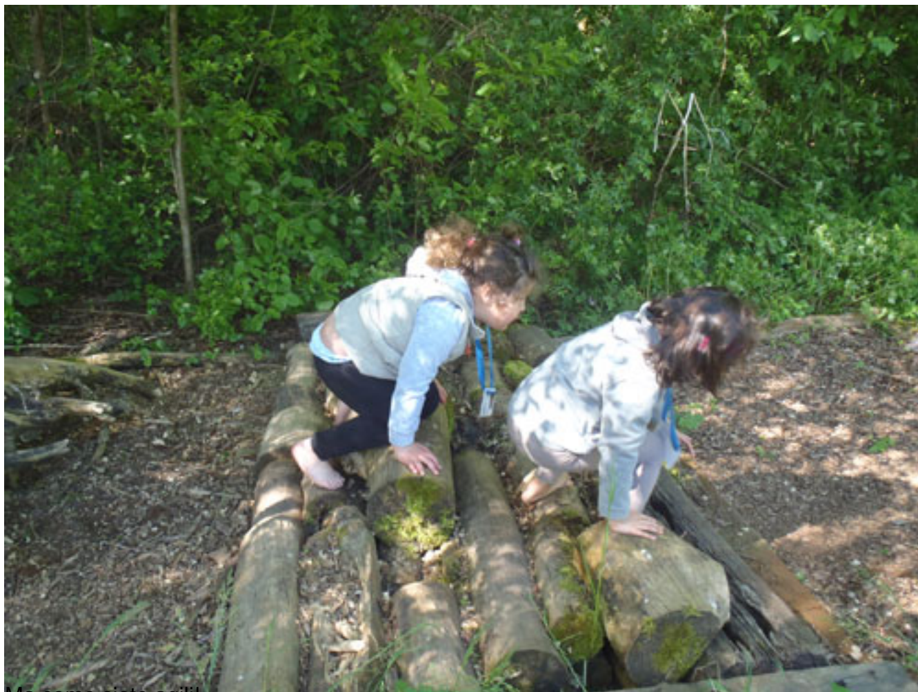
Ma come siete agili!