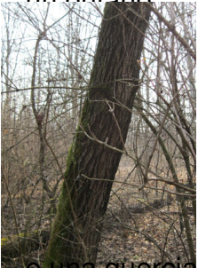
o una quercia...