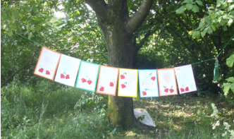
E la foto di gruppo!