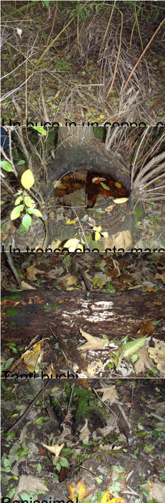
In buca in un cono con anche acqua ...