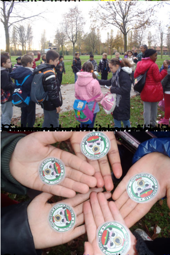
Un compleanno per il nostro vivaio!