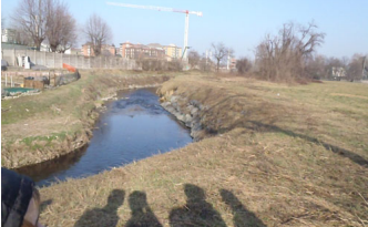
L'ultima immagine: l'ultimo "scarico" che entra nel fiume Seveso ...