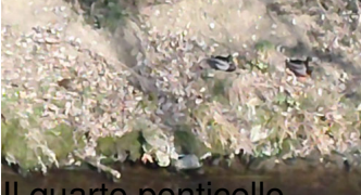
Il quarto ponticello ...