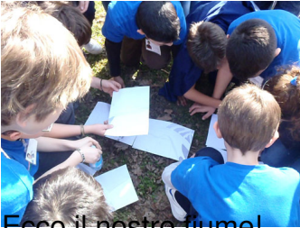
Facciamo il nostro fiume!