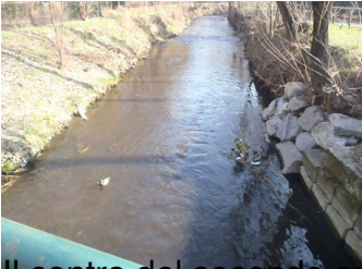
Il centro del secondo campo sportivo ... non si vede nulla!