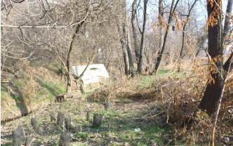
Che belle! Tantissime piantine di scilla (Scilla bifolia) ...