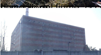
Il punto di uscita dell'acqua dal depuratore ...