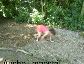
Anche i maestri