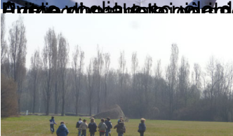
Ecco i nuovi dipinti: