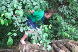
Alla fine qualche aerobazia.