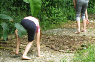
E' davvero molto divertente.