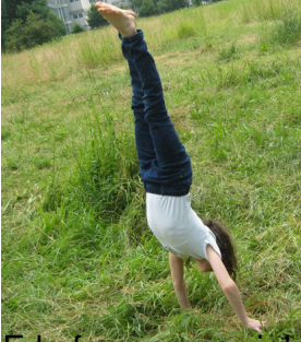
E la famosa carriola