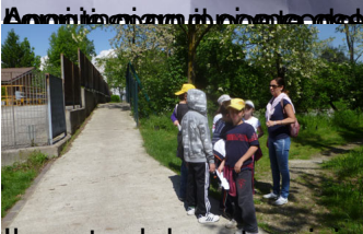
Il ponte del centro civico:

OGGI 3 MAGGIO 12 REGISTRIAMO il passaggio sul ponte ..... a piedi in bicicletta donne donne uomini uomini bambine bambini persone con cane persone con cane giovani giovani vecchi vecchi vigili/guardie vigili/guardie lavoratori lavoratori mamme con passeggino animali