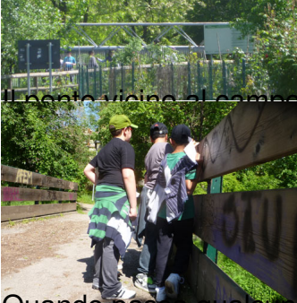
Il ponte vicino al campo sportivo: