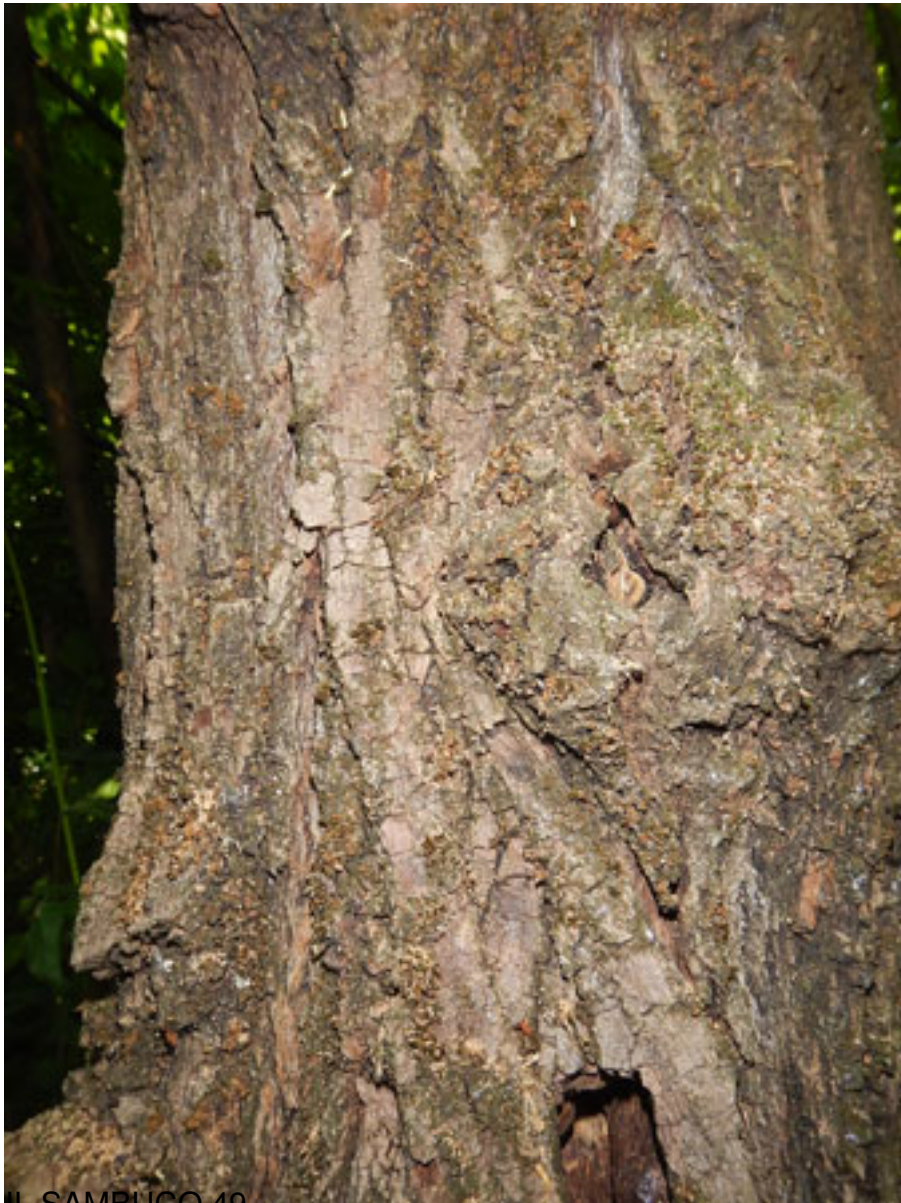
IL SAMBUCCO 49