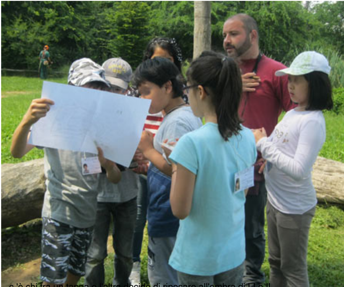
...c'è chi tra un tappa e l'altra decide di riposare all'ombra di LI e IL...