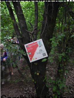
Sambuco 10 (muschio 96) ...