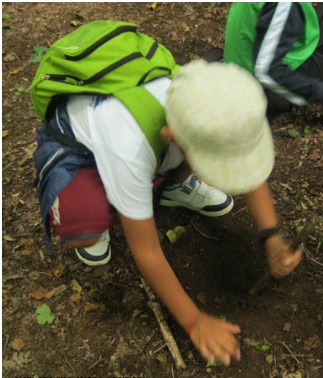
... e chi assume strane posizioni...