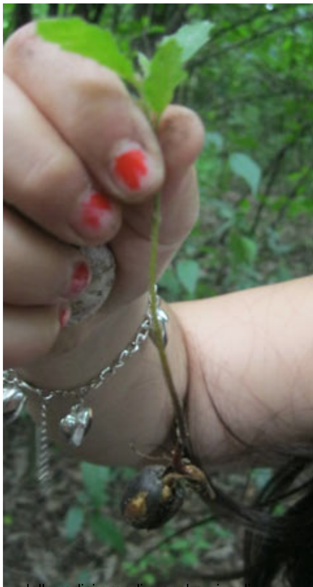
dalle radici grandi e anche piccole