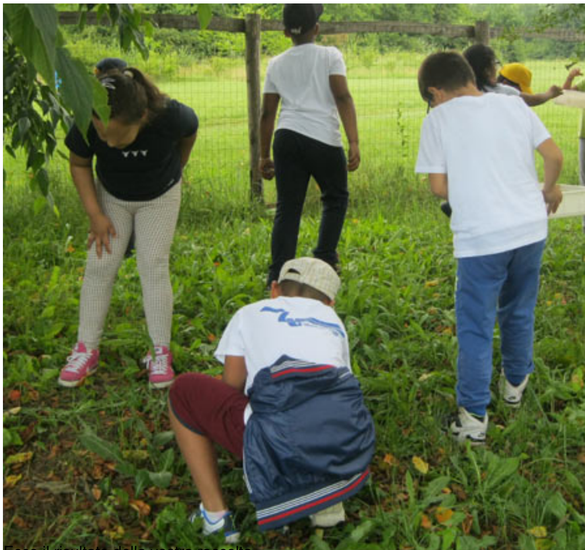
Ecco il risultato della vostra raccolta....