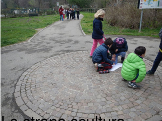
La strana cultura