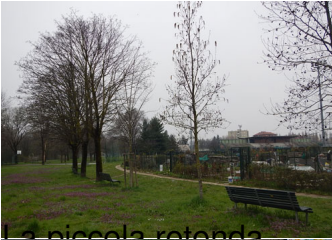
La piccola rotonda