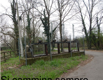
Si cammina sempre