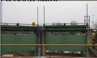
C'è anche un po' di schiuma non proprio bene invitante ...