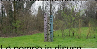
Le norme in disuso