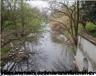
Il fiume che scorre a Bressana Bottarone un po' di cammino per risalire fino a Cormano,