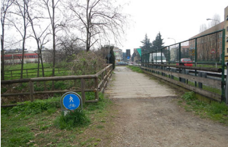
Il ponte poco dopo la strada, vicino al centro sportivo di Bresso ...