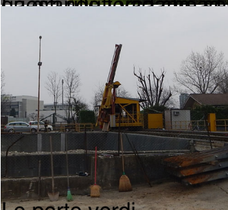
Le porte verdi