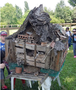
...e in un pascolo. In tutti i vari luoghi è corretto.