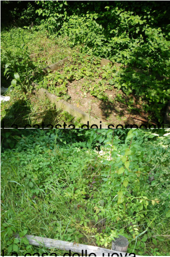
...sta dei so...