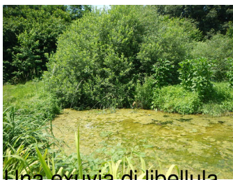
Una covia di libellula che porterete a scuola