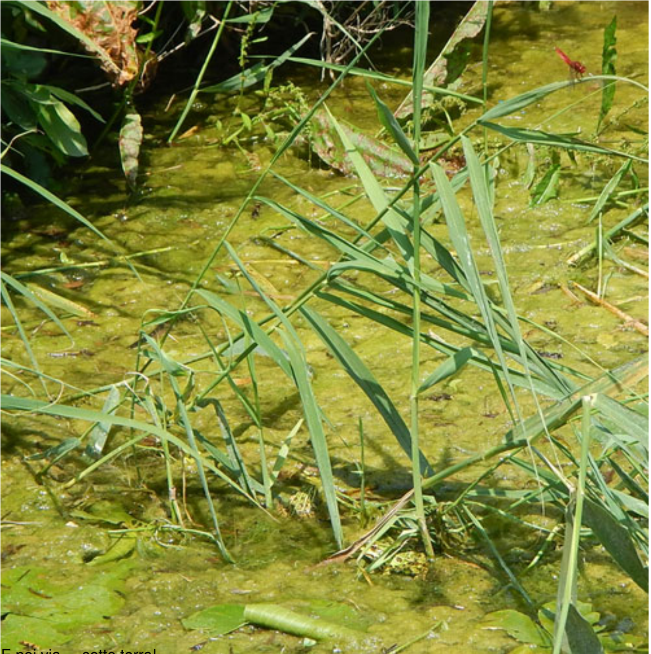
E noi via sotto terra!