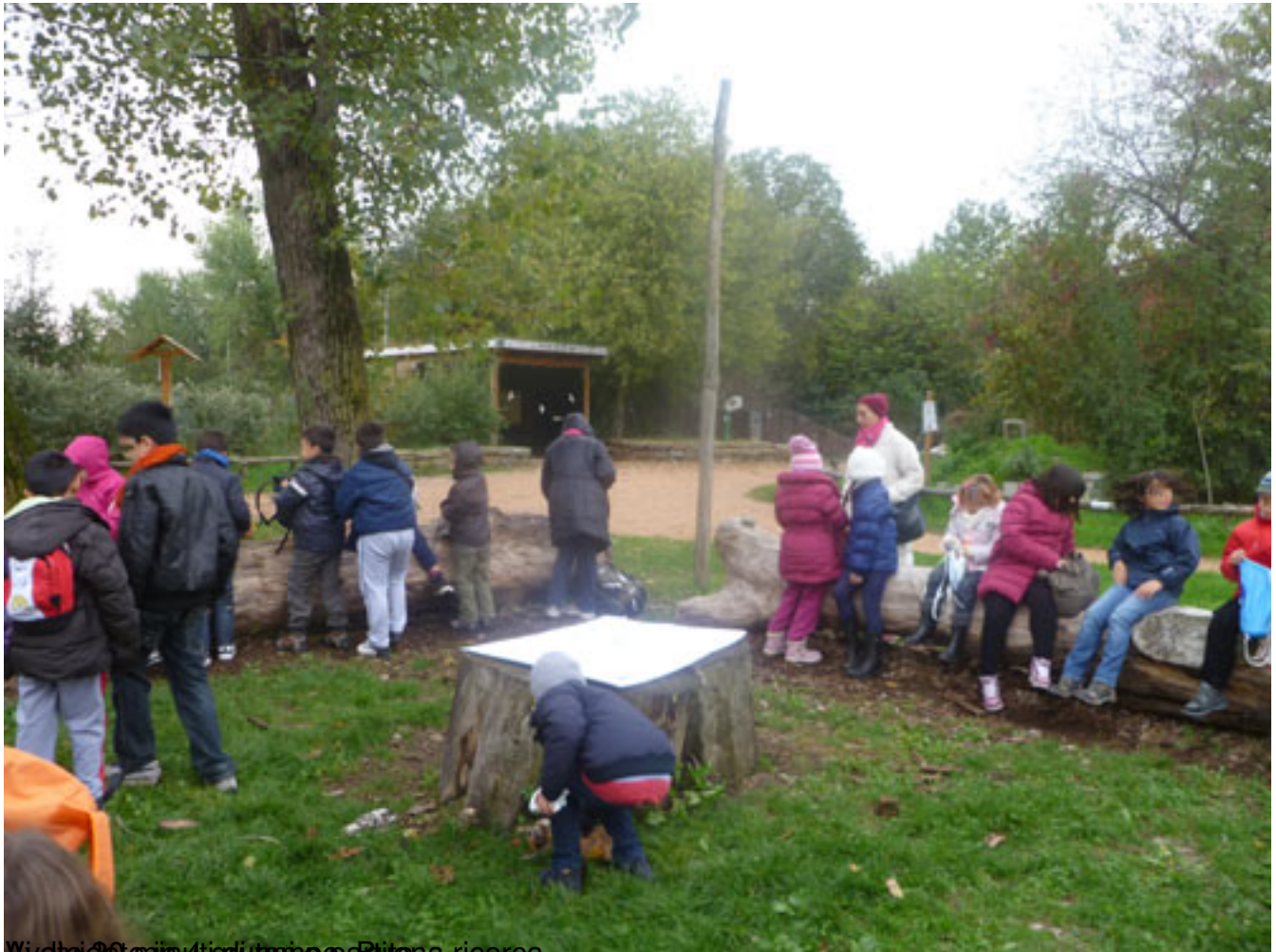
Wildebeest in un gruppo a Butera ricerca.