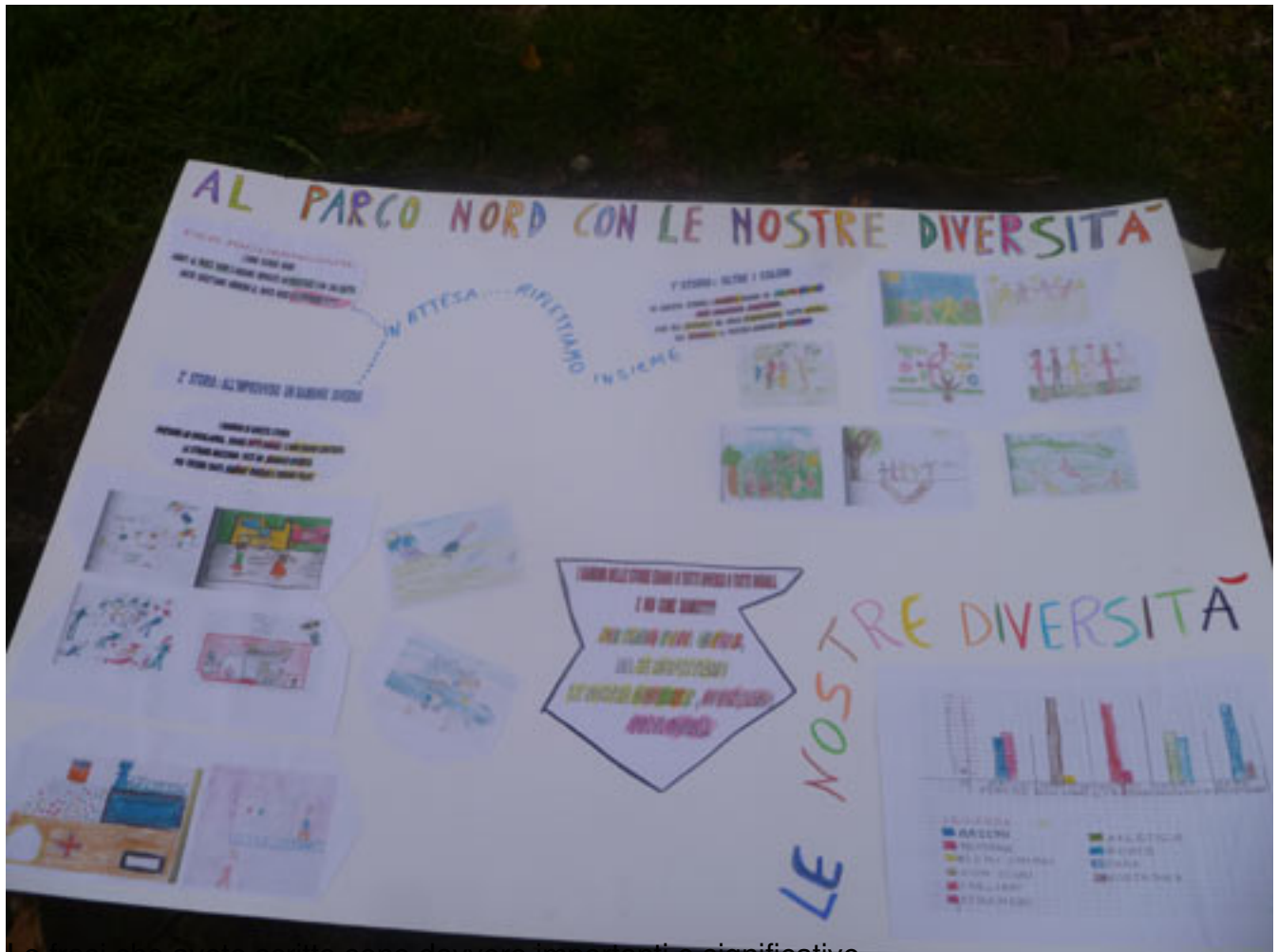
Le frasi che avete scritto sono davvero importanti e significative.