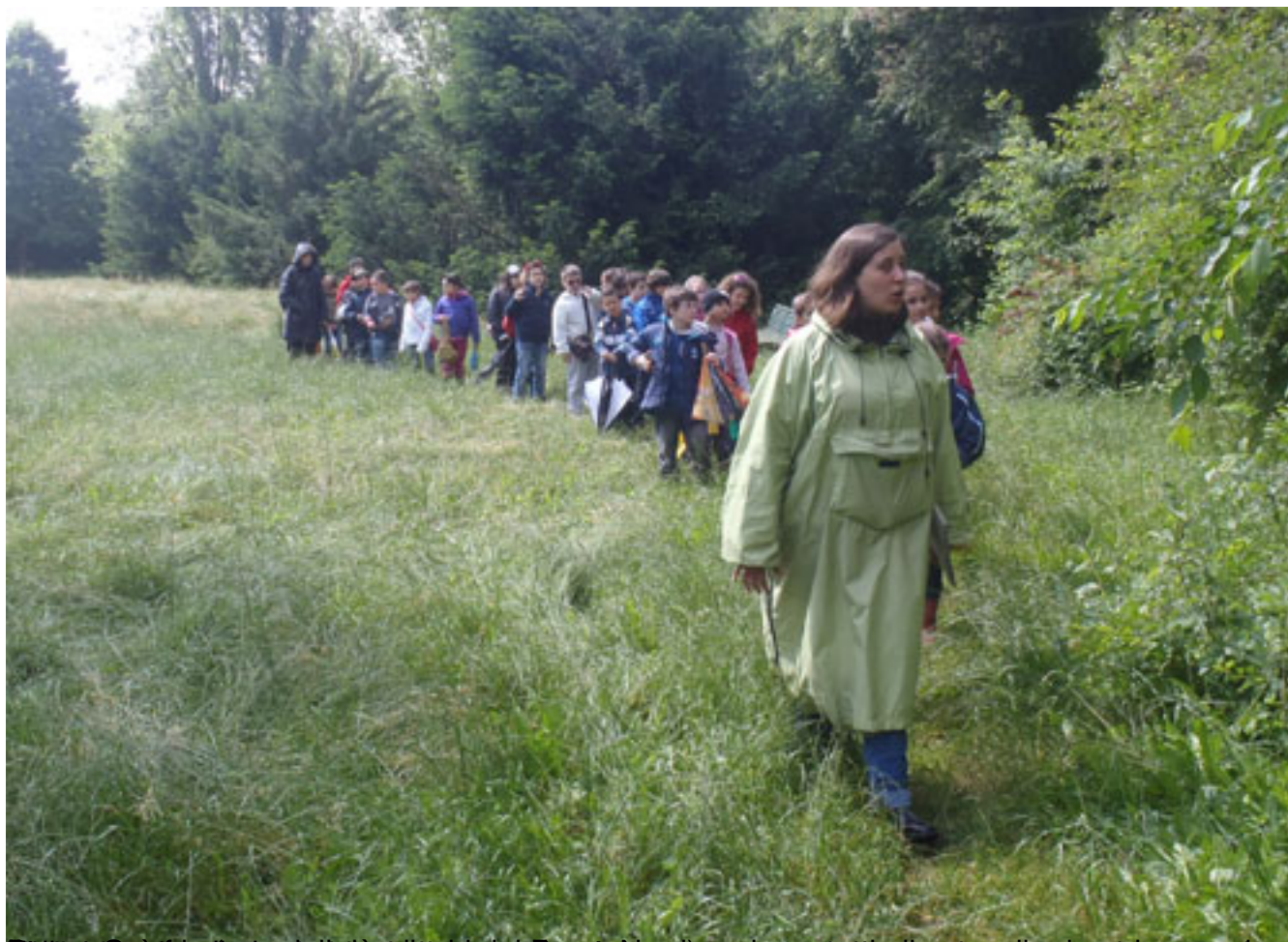
Il percorso è la guida si sta a guidare il gruppo, non si separano a più gli ostacoli ed è un ambiente