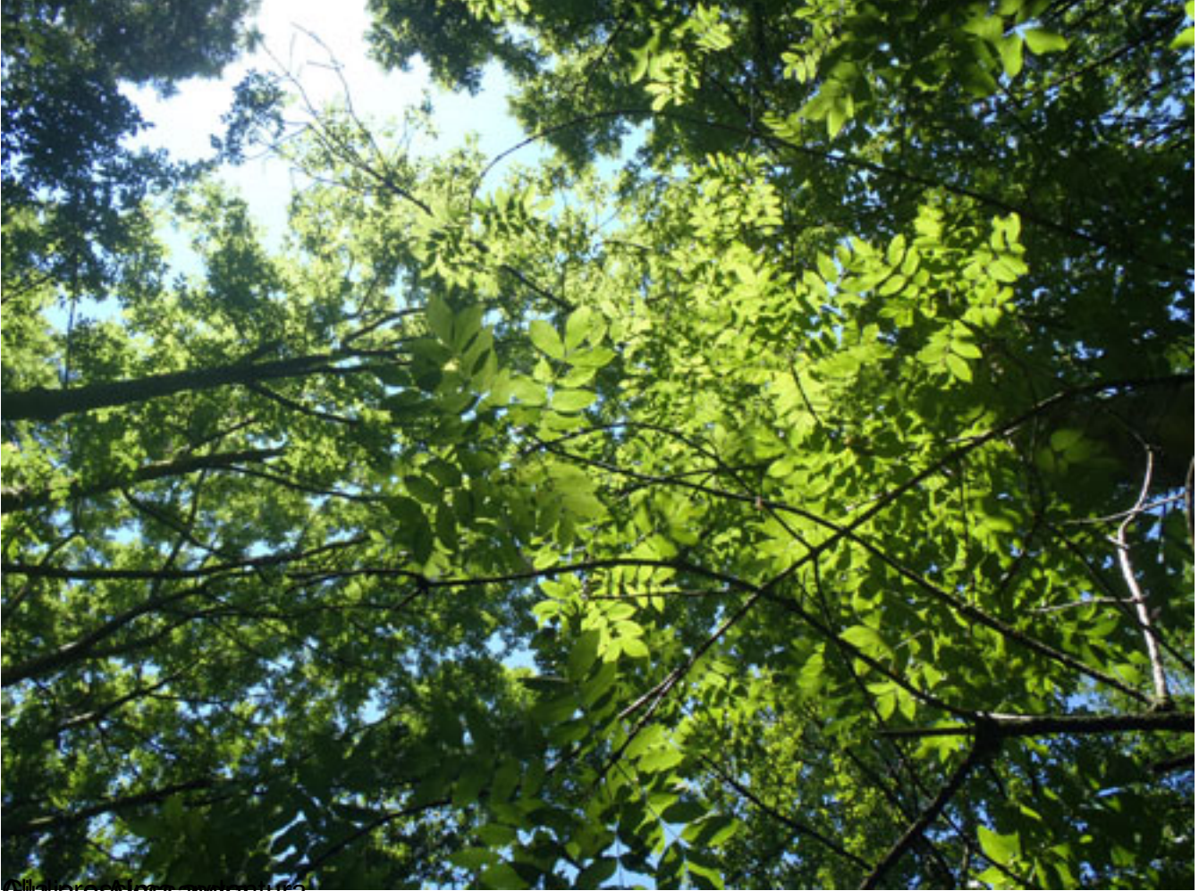
È la stessa avventura.