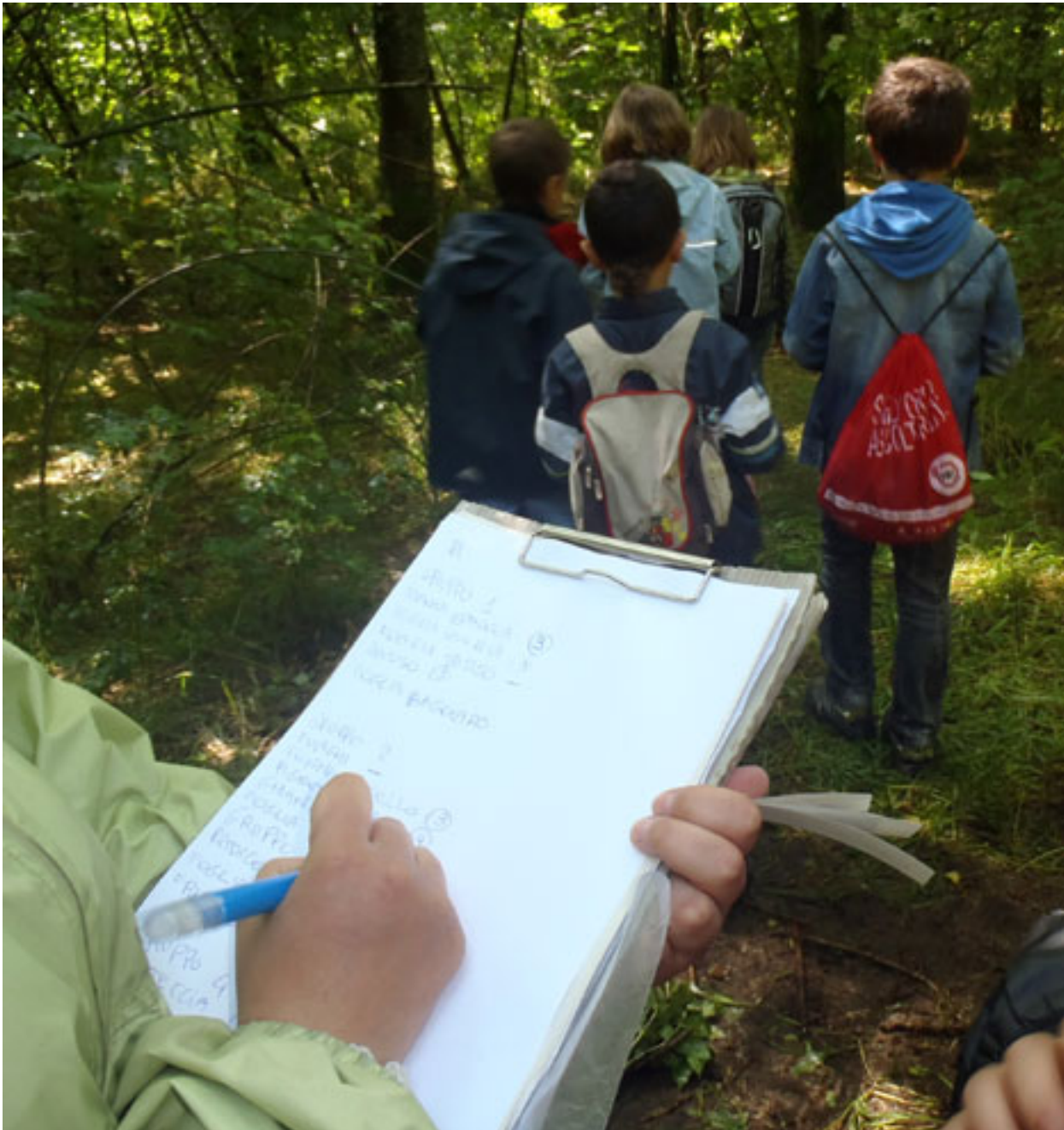
Nota: Per legge, tutti i dati personali e i dati di contatto sono stati anonimizzati e non sono utilizzabili per identificare i singoli individui.