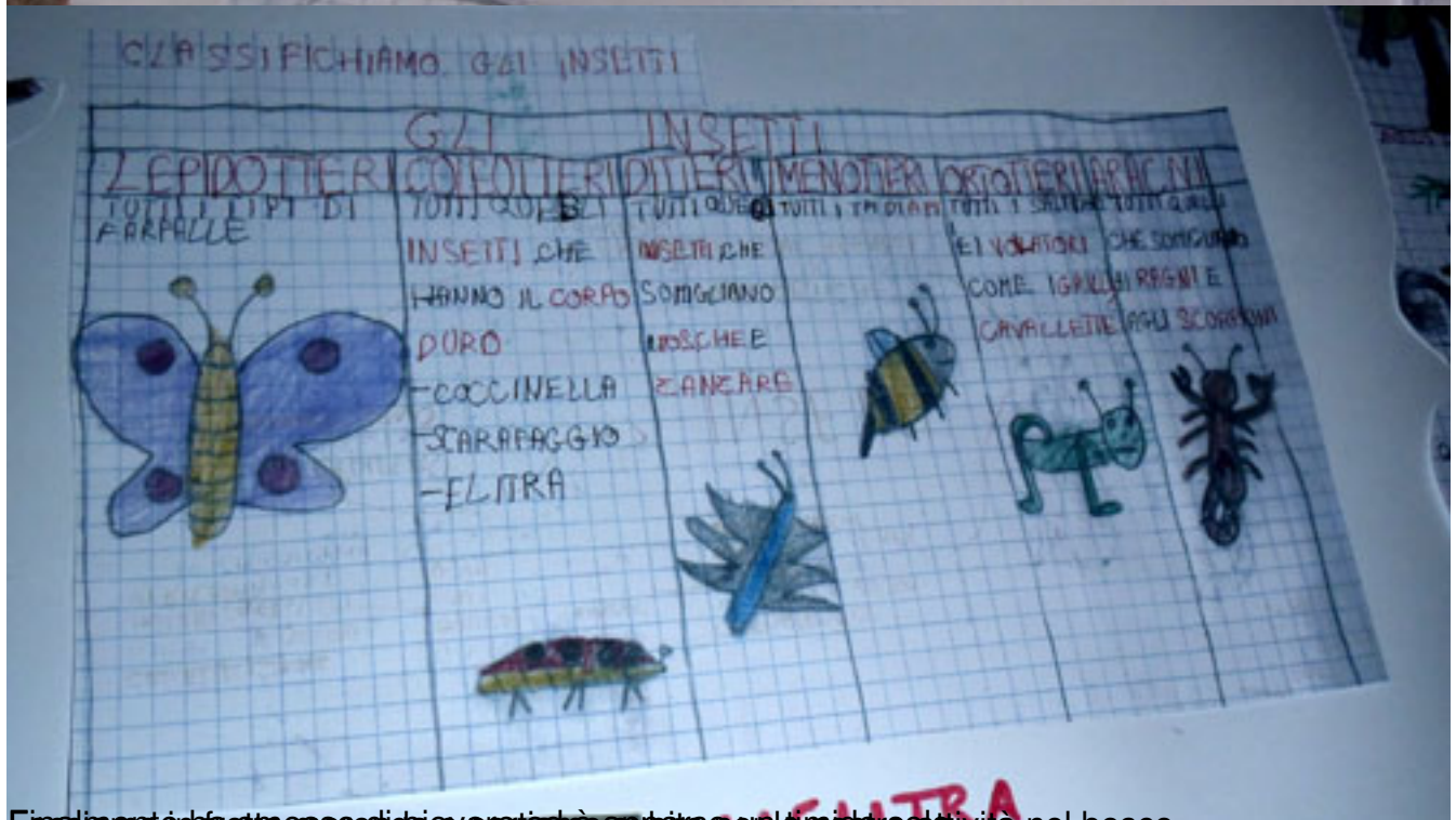
Facciamo un'attività di classificazione per i bambini per la mostra di vita nel bosco.