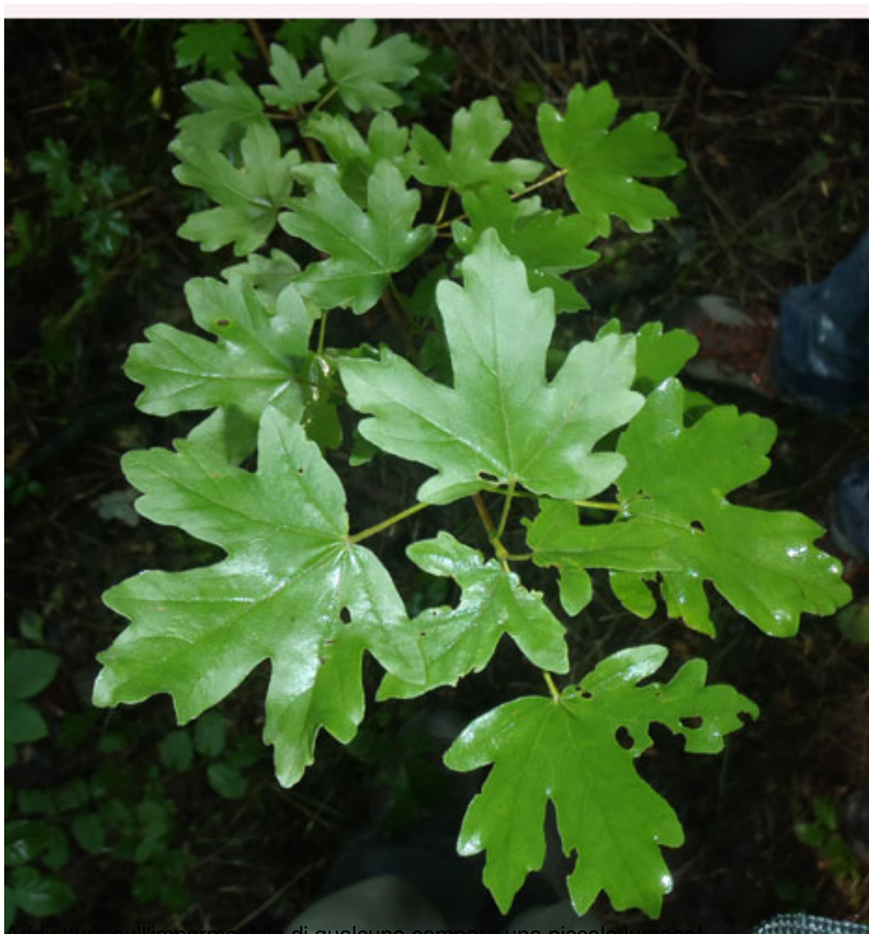
Adiantura sull'impermeabile di qualcuno compare una piccola lumaca!