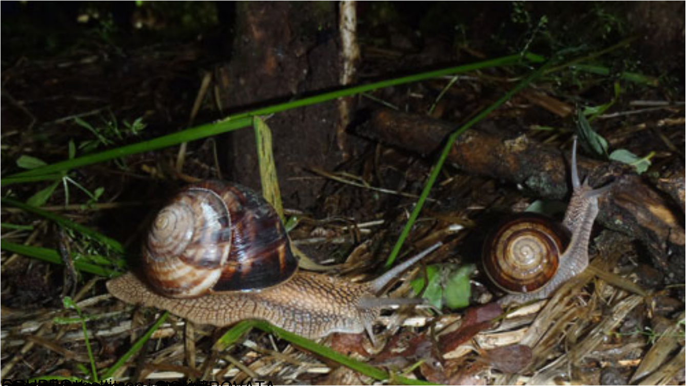
ROVATA Si è trovato la foglia di baccharo spinoso di molto in