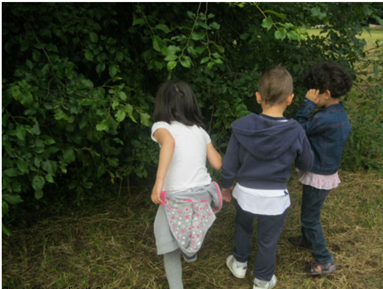
Che ci sarà mai lì sotto?