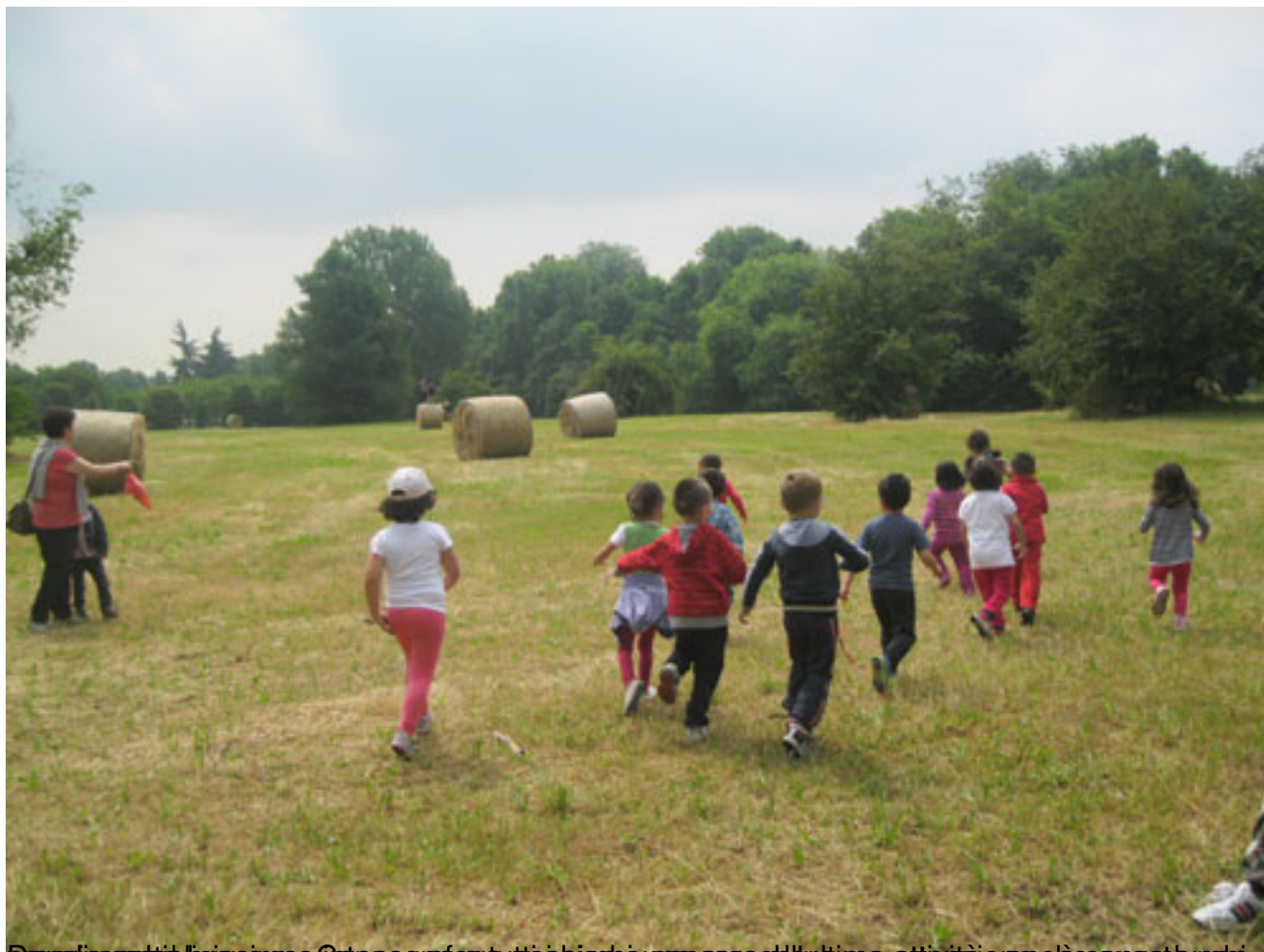
Dopo il pasto in sala da pranzo tutti i bambini passano all'ultima attività in cui è prevista un'uscita in campo.