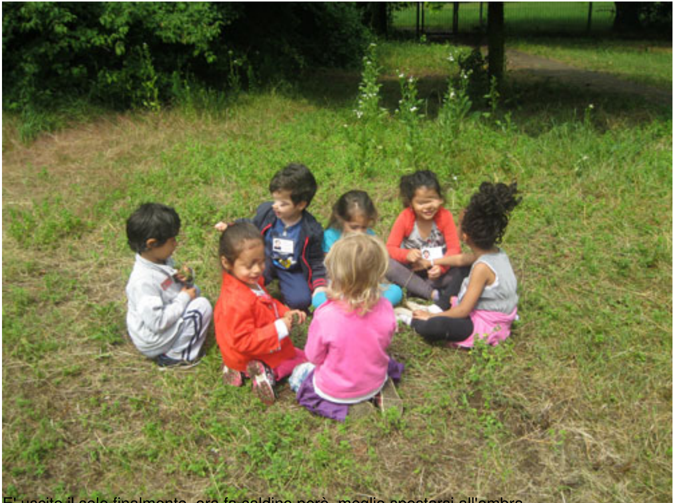
E' uscito il sole finalmente, ora fa caldino però, meglio spostarsi all'ombra...