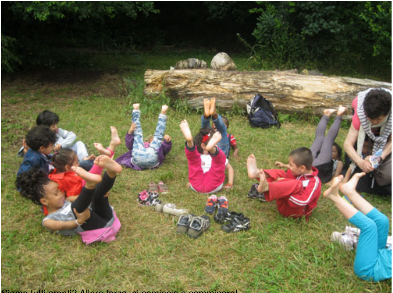
Siamo tutti pronti? Allora forza, si comincia a camminare!