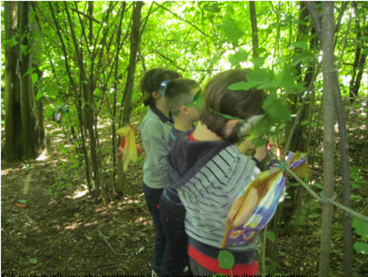
C'è però qualcuno che preferisce stare in gruppo per evitare di perdersi...