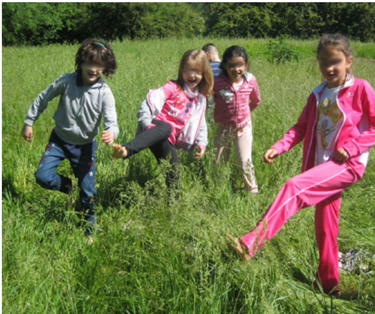
Dopo la visita al campo di calcio, i bambini hanno assistito al Dupele, un complesso di danze e di prove (a spole)