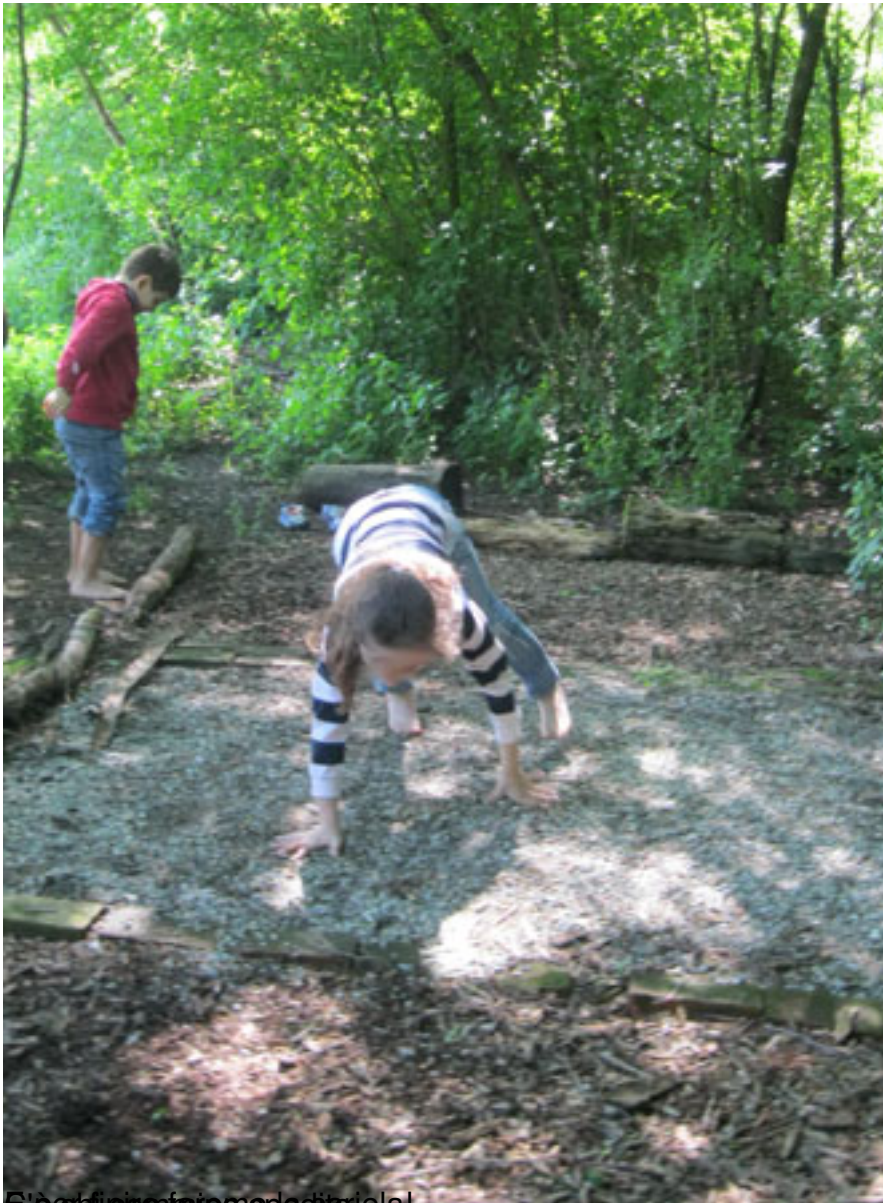
È per i bambini fare spettacoli!