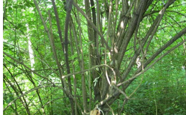
Il Sambuco - Serval di Serena e Valentina