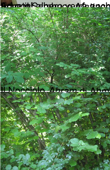
Il Sambuco Tornale di Tomaso e Alessio

Il GPS è un sistema di navigazione satellitare che permette di determinare la posizione geografica di un punto in qualsiasi momento e in qualsiasi luogo.