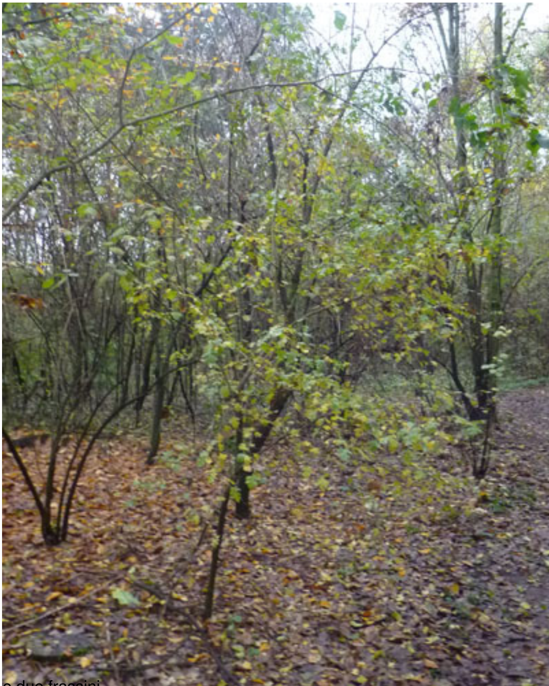
e due frassini,