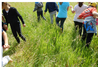
Poi lungo il percorso sensoriale ...