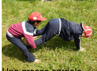
Una grossa carriola ...