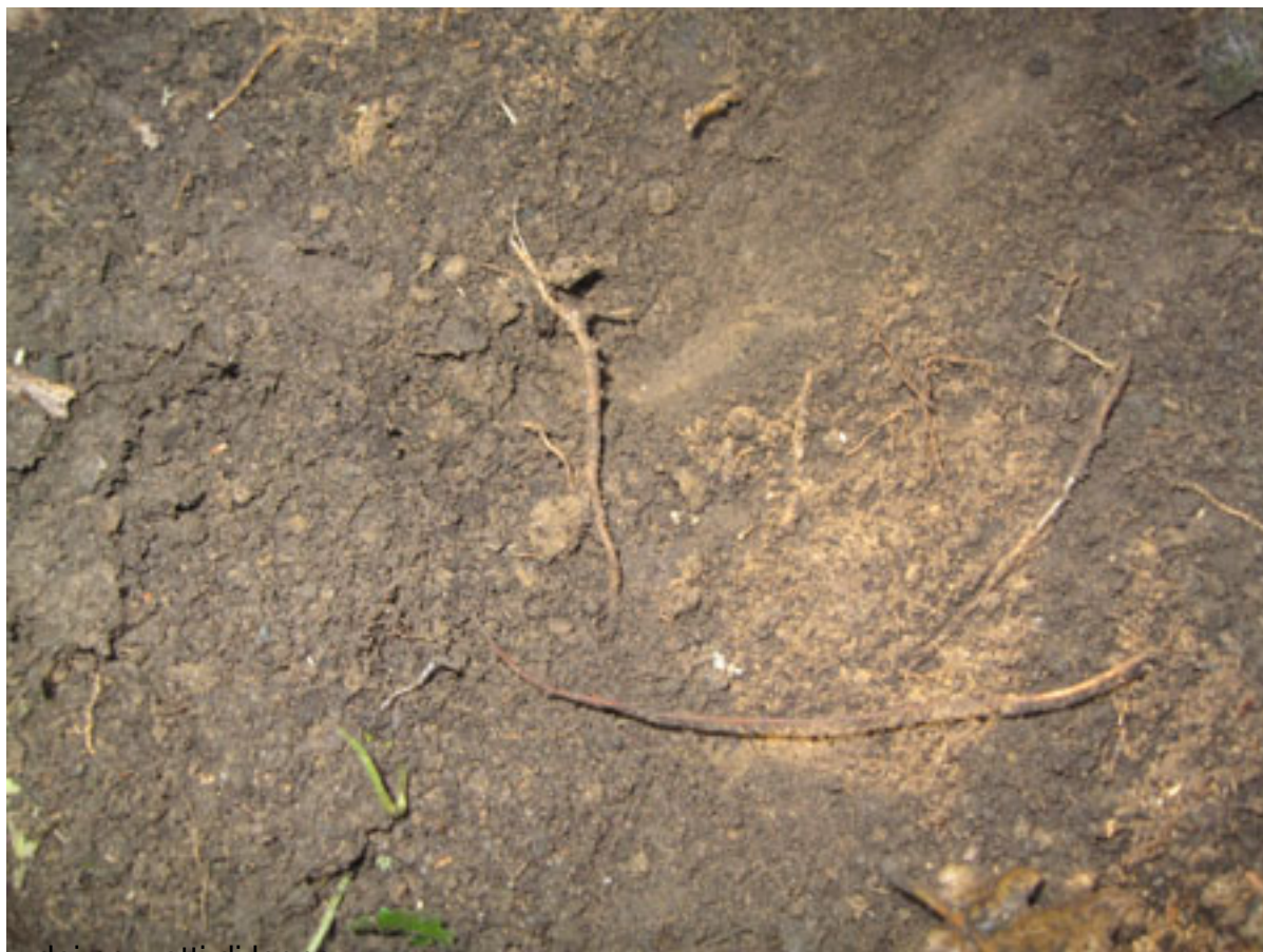
dei pezzetti di legno