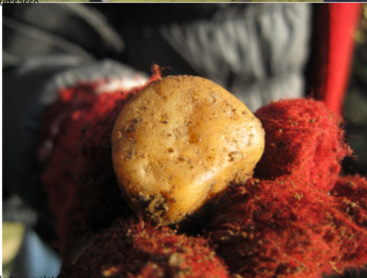
la terra gelata...