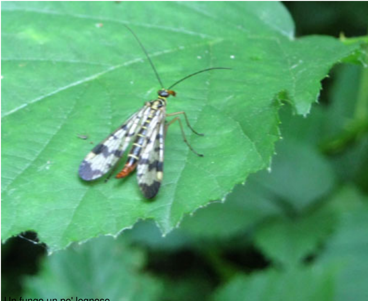
Un fungo un po' legnoso