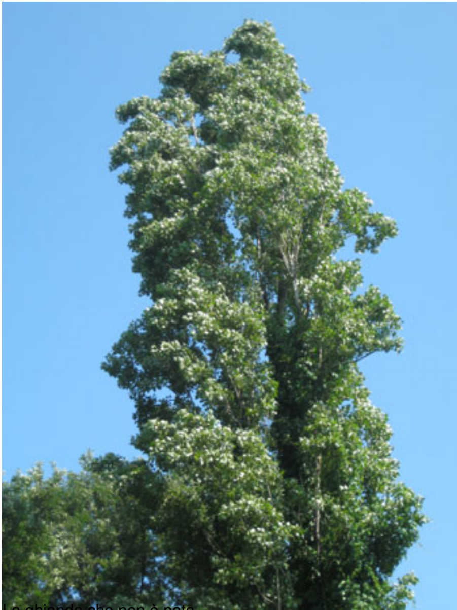
La ghianda che non è nata