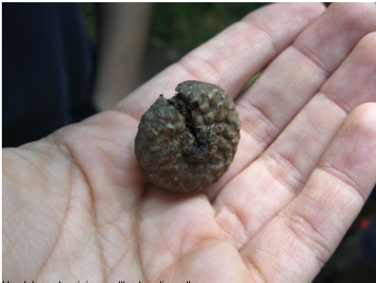
Una falena che si riposa all'ombra di un albero