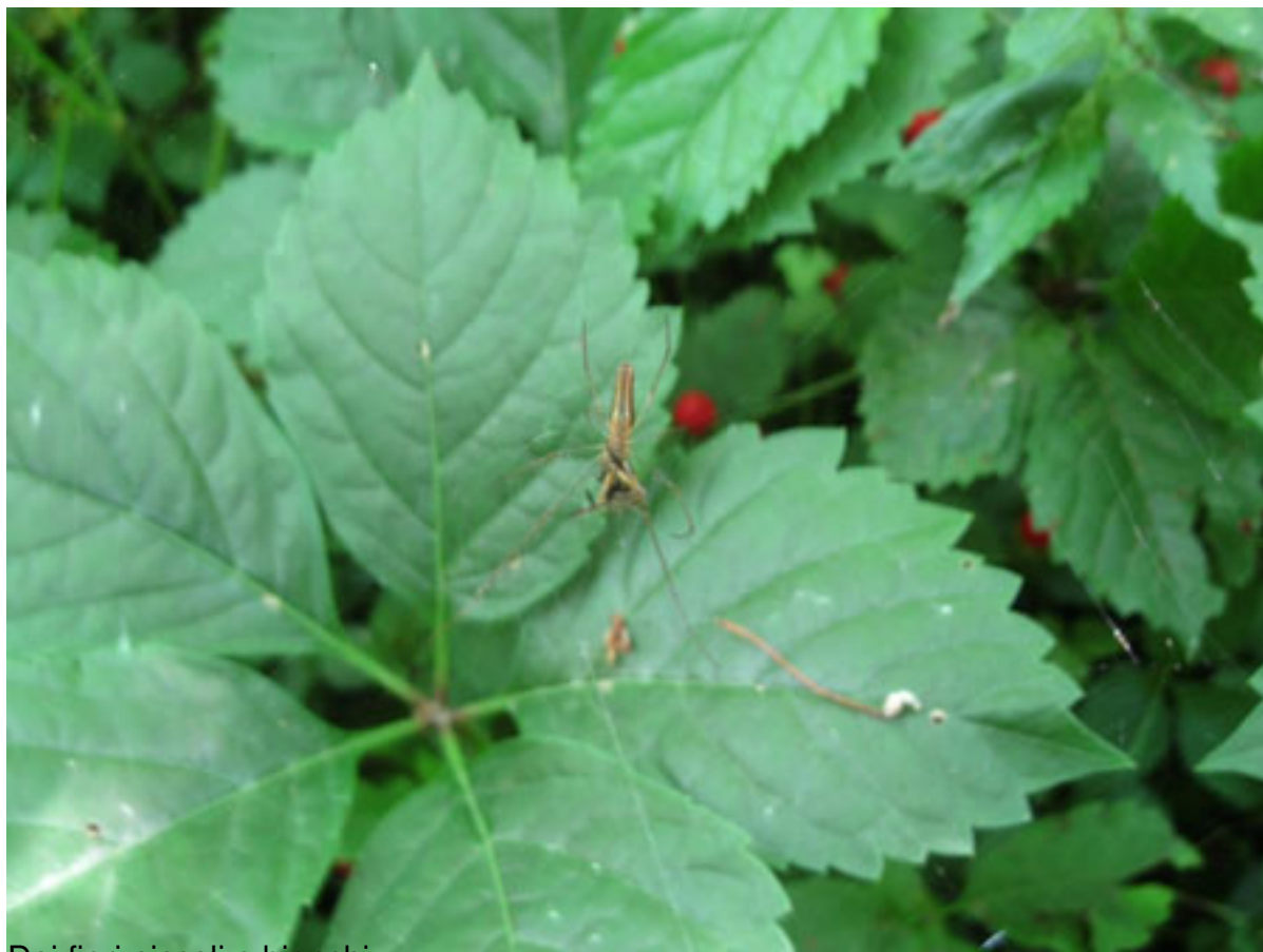
Dei fiori piccoli e bianchi