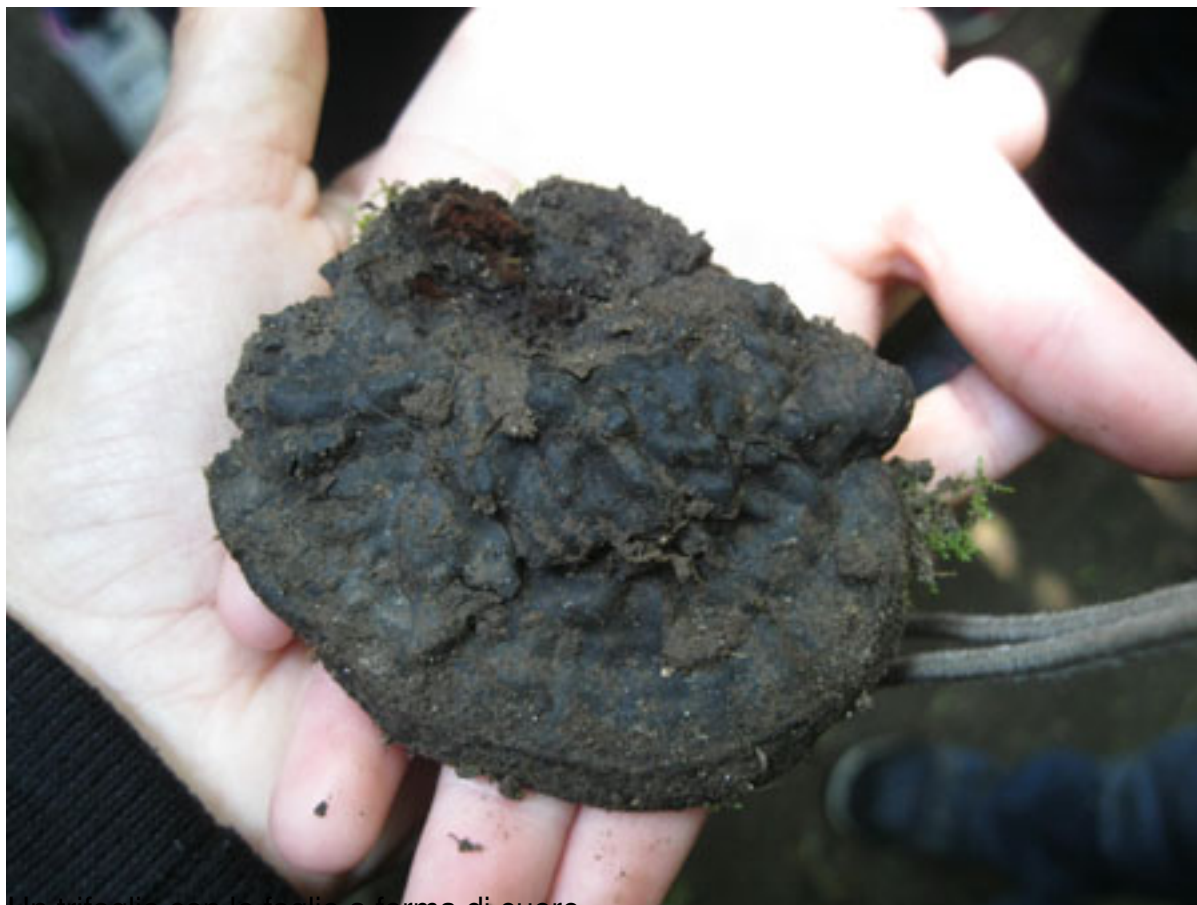
Un'infestazione di termiti a forma di cuore