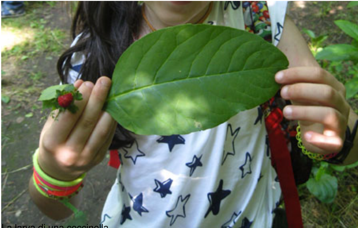
La larva di una coccinella