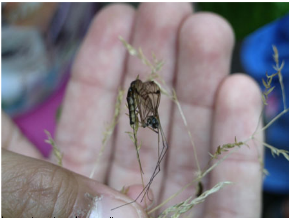
Le nervature interne di un rametto