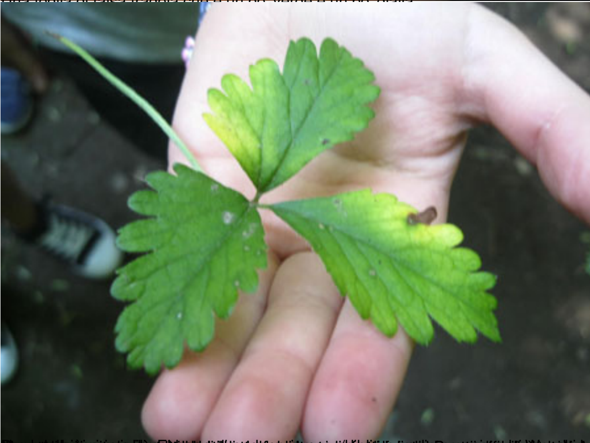
Per chi ha difficoltà a leggere, ecco il testo dell'immagine: Una foglia di falsa fragola che è un po' verde e un po' gialla