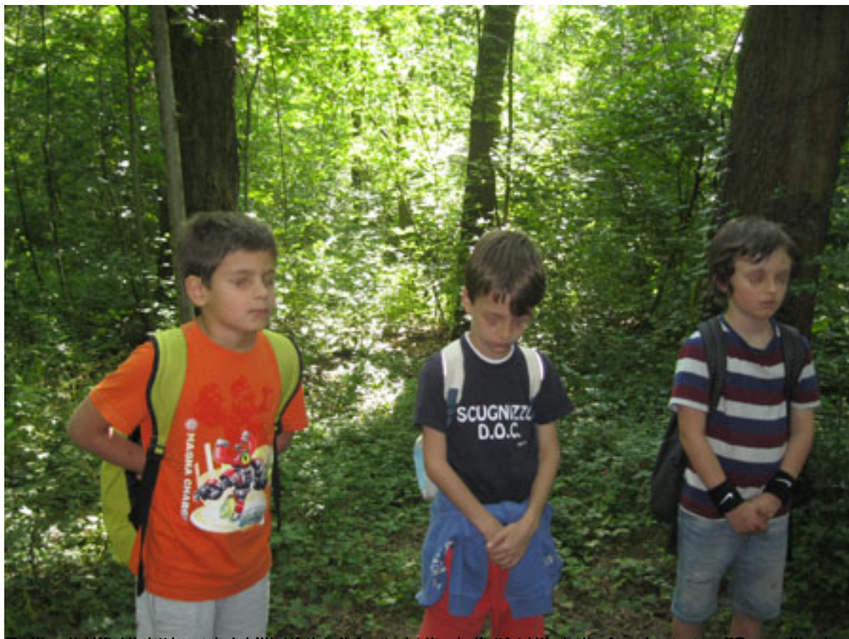
Del progetto si è trattato di un'attività che ha coinvolto tutti i ragazzi della classe di Scienze e tutti i bambini della classe di Scienze.