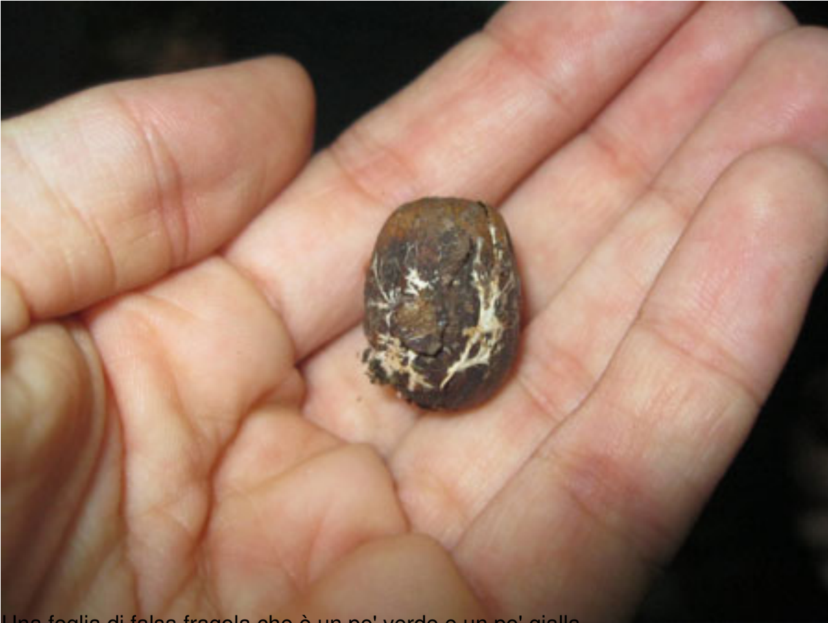
Una foglia di falsa fragola che è un po' verde e un po' gialla