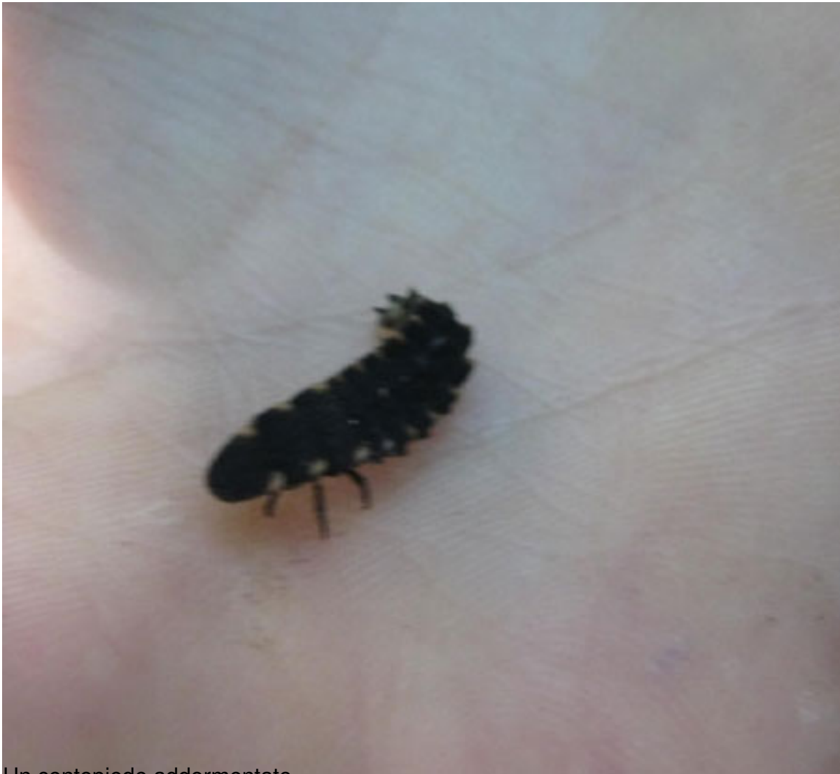
Un centopiede addormentato