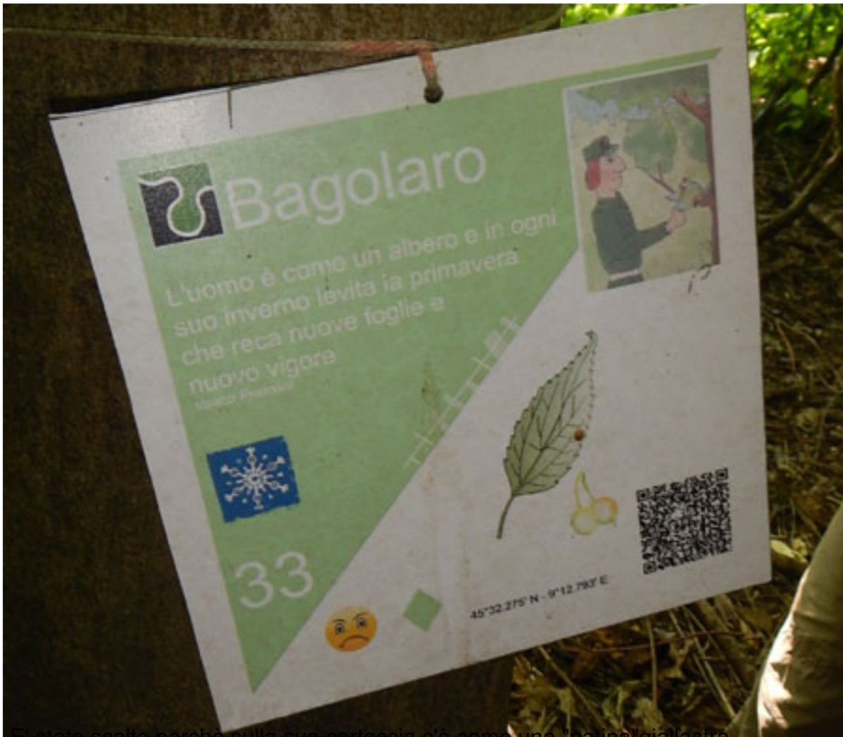
È stato scelto perché sulla sua corteccia c'è come una "patina" giallastra.