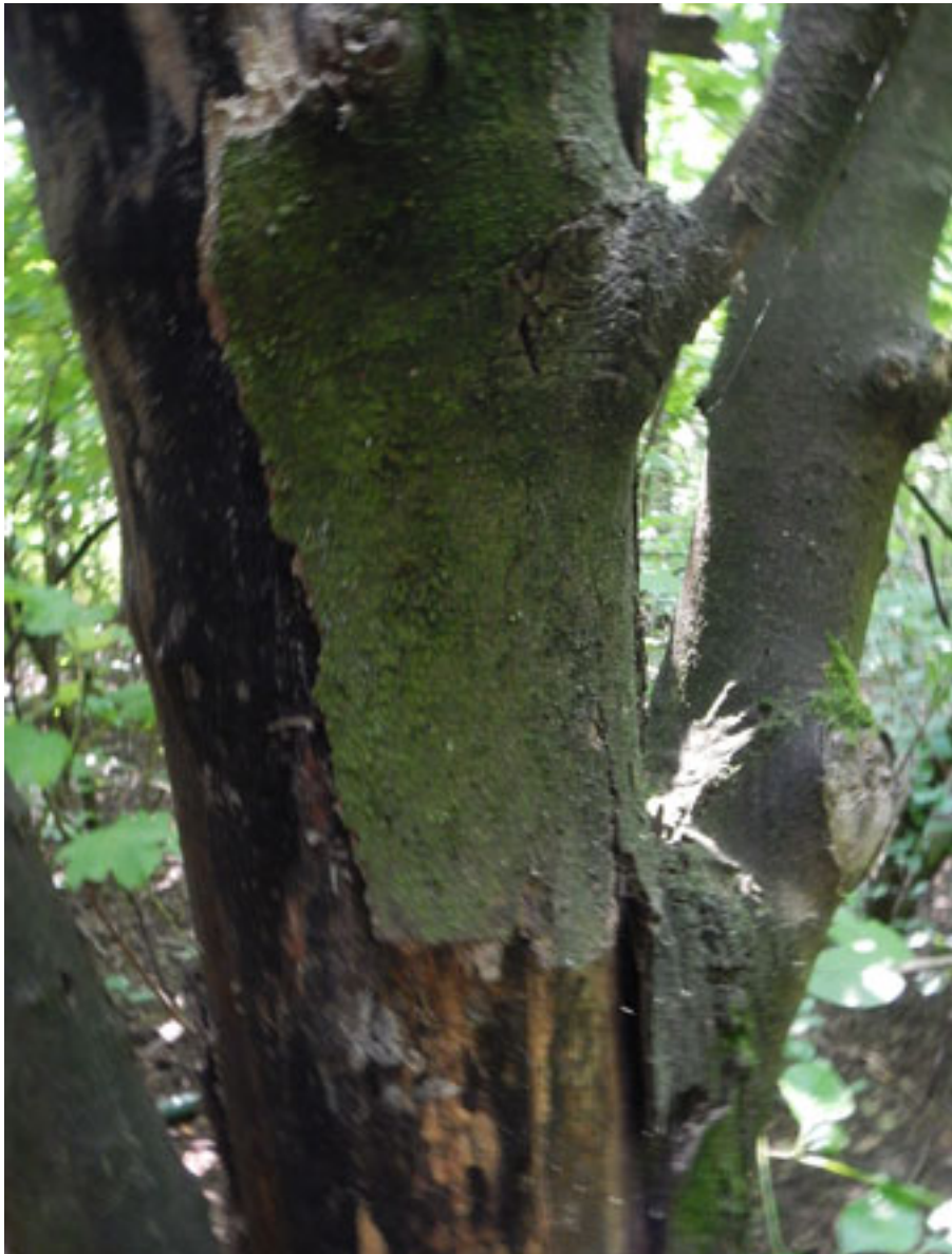
Agave Canisapina angustifolia, licheni, funghi, ragni, coleotteri, piante epifite, coleotteri, alta parassitismo, diversi erici, alghe, corisce