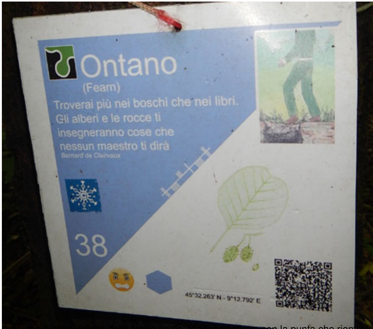
Il gruppo è stato colpito dalle foglie un po' tondeggianti ma con la punta che rientra!