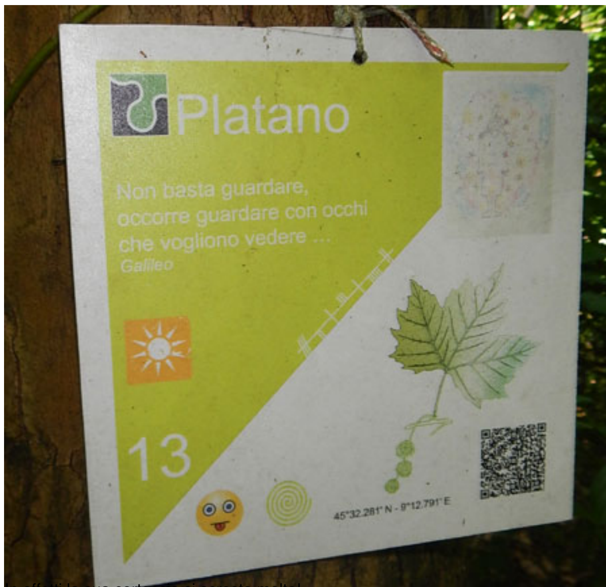
In effetti la sua corteccia si scrosta molto!