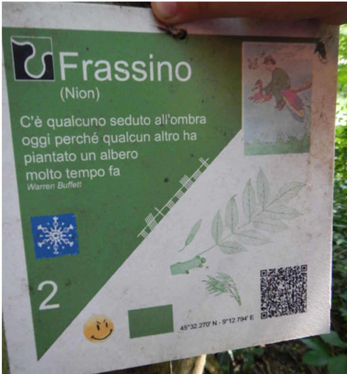
Le sue foglie sono molto in alto e si fa fatica a vederle...Ma noi ci aiutiamo con il cartellino.