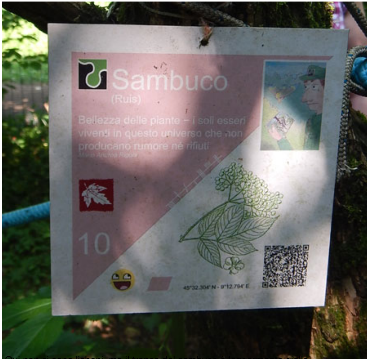
Qui non ci sono licheni, ma il tronco del sambuco è leggermente grigio.