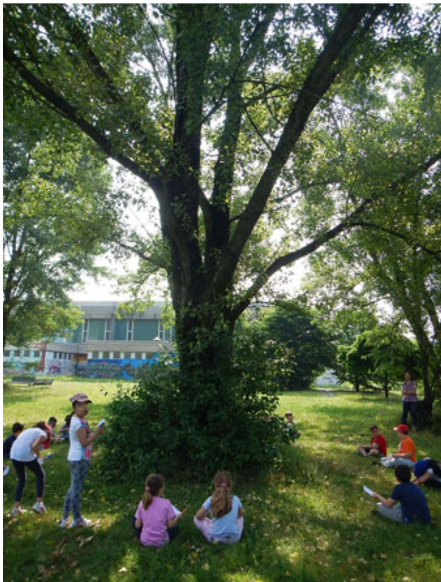
Sopra il titolo c'è una foto di un'attività di lavoro in gruppo, si vede una grande area verde con un albero molto grande e un gruppo di bambini seduti sul prato. In basso a destra c'è una foto di un'attività di lavoro in gruppo, si vede una grande area verde con un albero molto grande e un gruppo di bambini seduti sul prato.