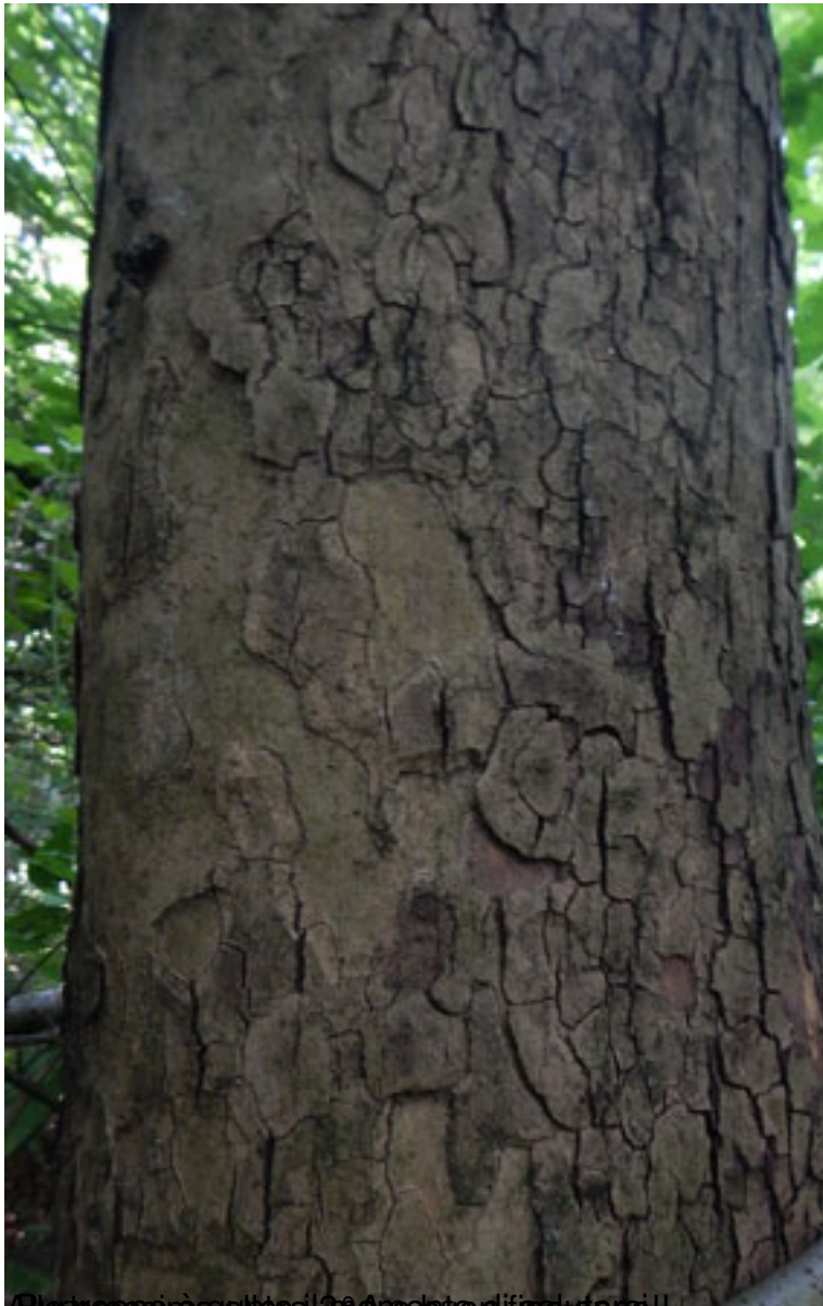
Alta poppi e galloca in un albero di salice!!