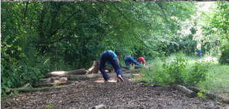
Durante l'attesa qualcuno si "traveste" ...