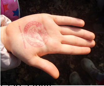
Ciao a tutti!