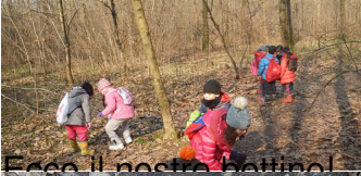
Ecco il nostro bottino!