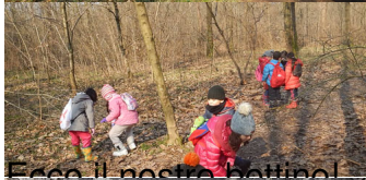
Ecco il nostro bottino!