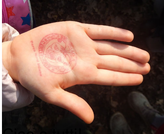
Ciao a tutti!