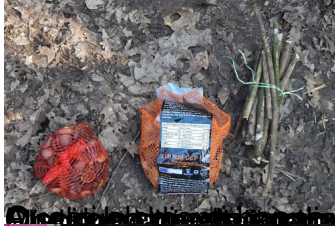
Ogni gruppo ha raccolto materiali di diversa natura e consistenza, ma con tempi differenti.