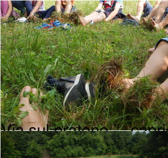
Via sul ventre, sulle ginocchia e ruote!