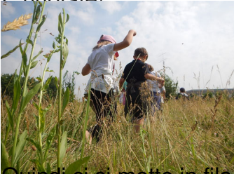
Quindi ci si mette in fila, lungo il percorso multimateriale ... a piedi ...