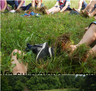
Via sul ventre, sulle ginocchia e ruote!