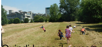
Quindi lungo il percorso multimateriale, a piedi ...