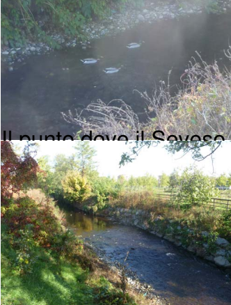
Il punto dove il Seveso fa la sua curva prima di entrare dentro al depuratore ...