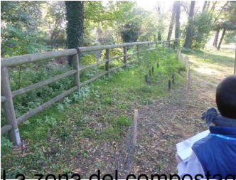
La zona del compostaggio degli orti per anziani ...