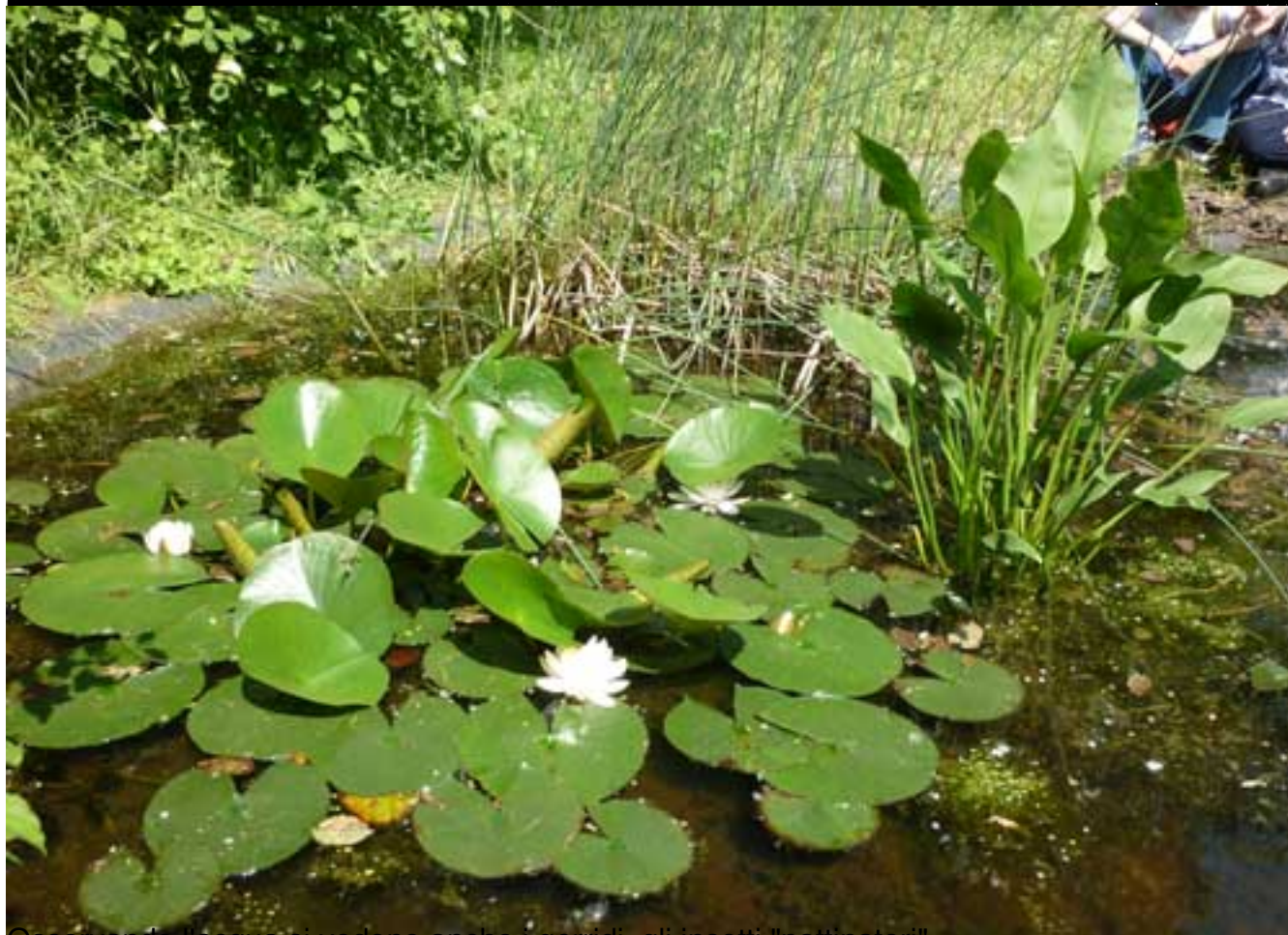
Osservando l'acqua si vedono anche i gerridi, gli insetti "pattinatori".