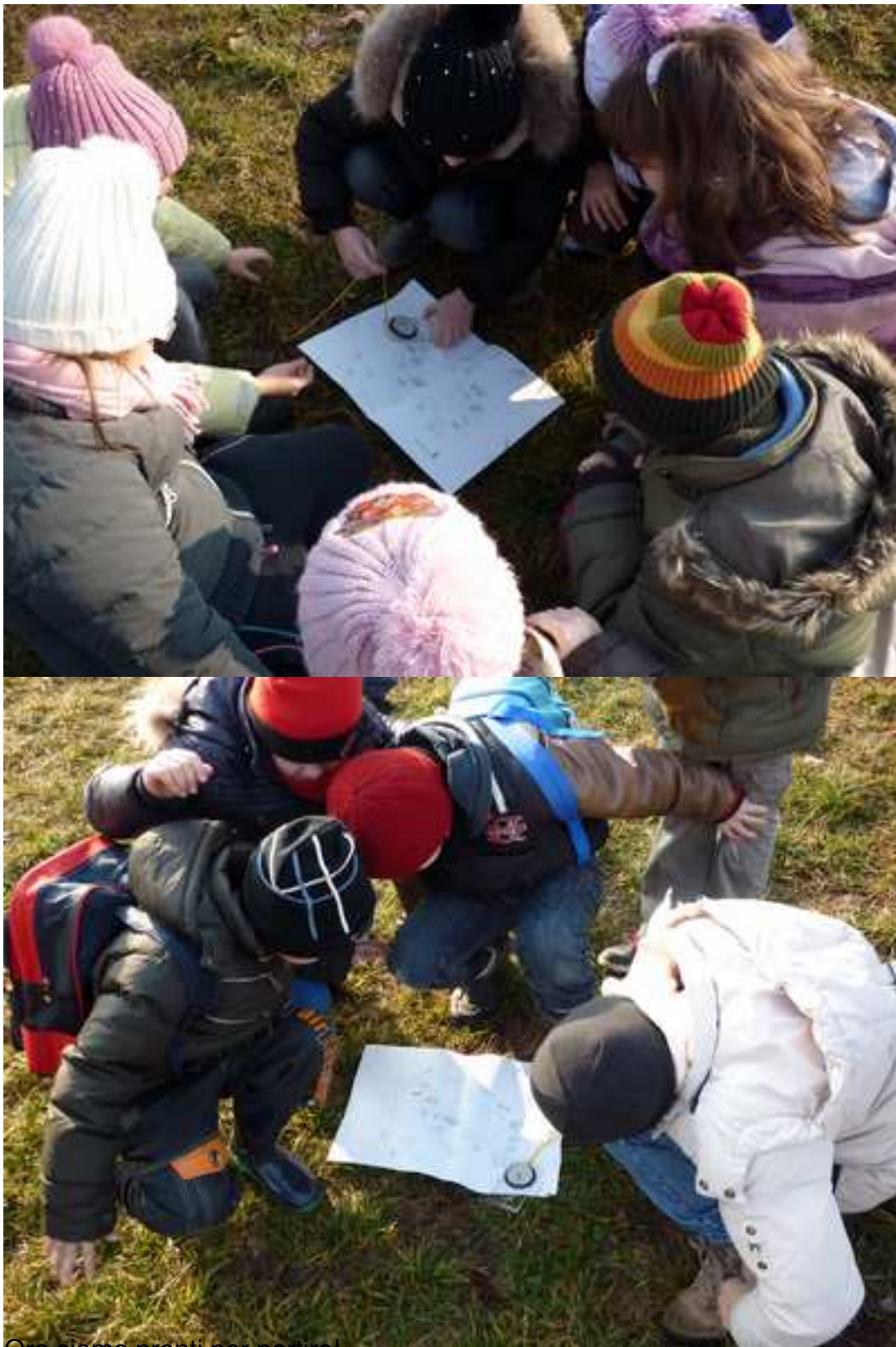
Ora siamo pronti per partire!