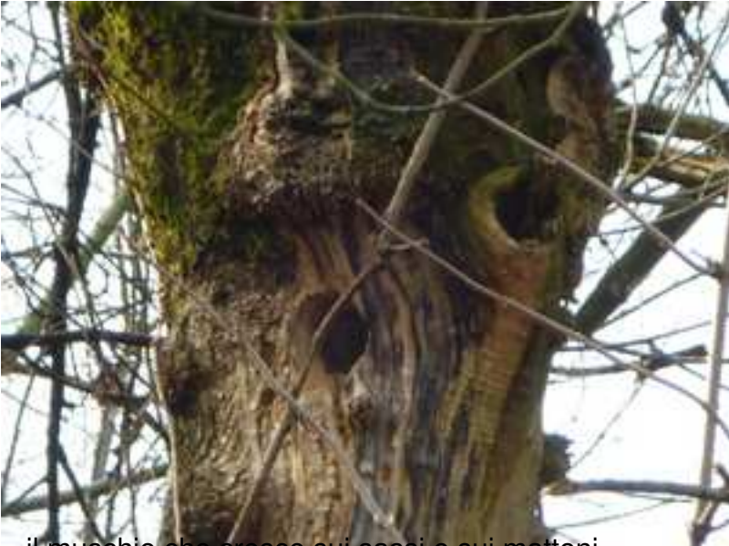
il muschio che cresce sui sassi e sui mattoni