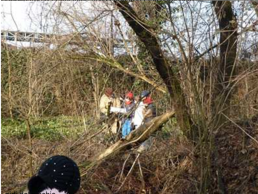
I nidi del picchio...