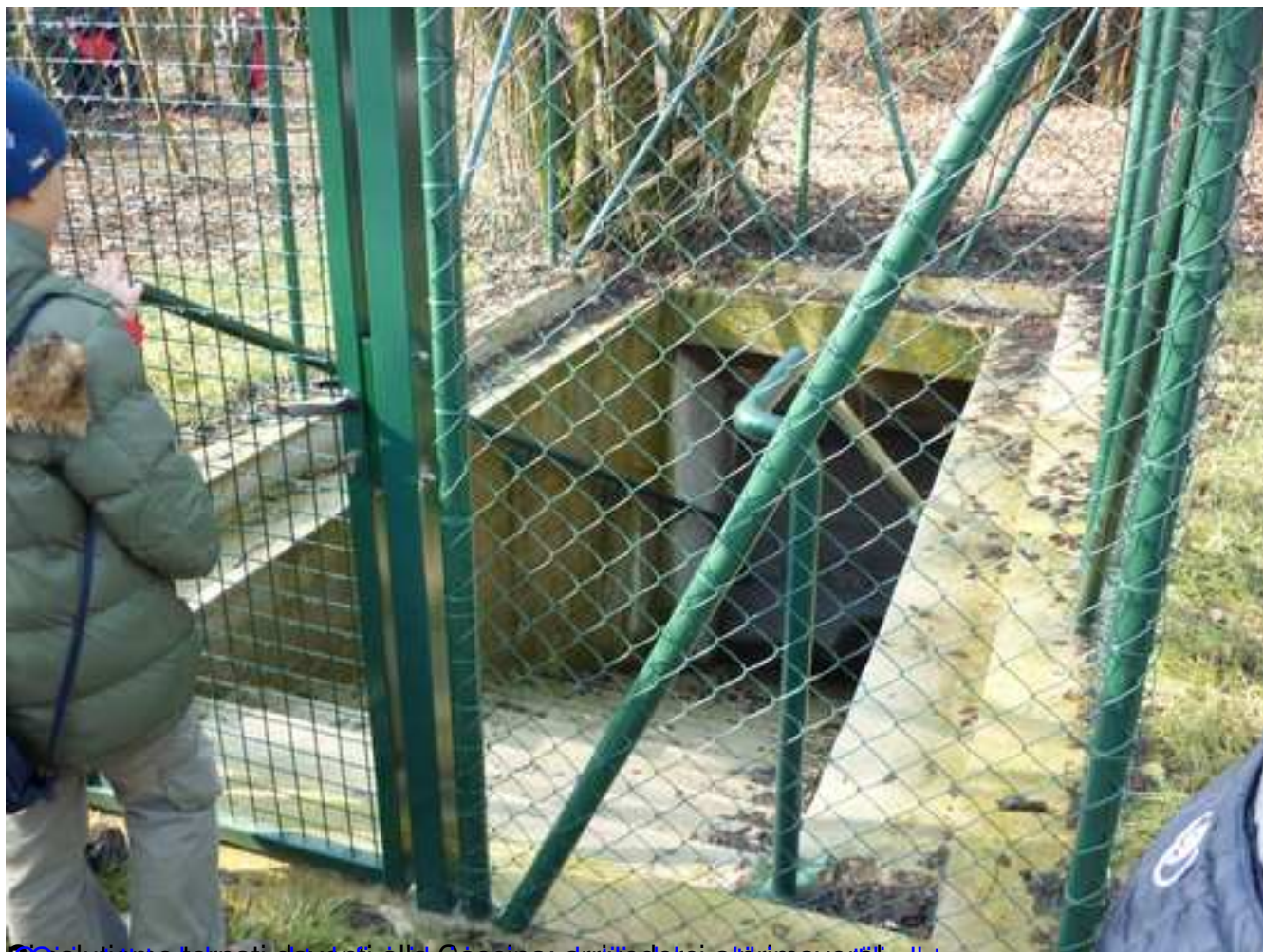
Cosa stiamo togliendo davanti alla Cassina e chi lo sta appiccando alla tonappa.