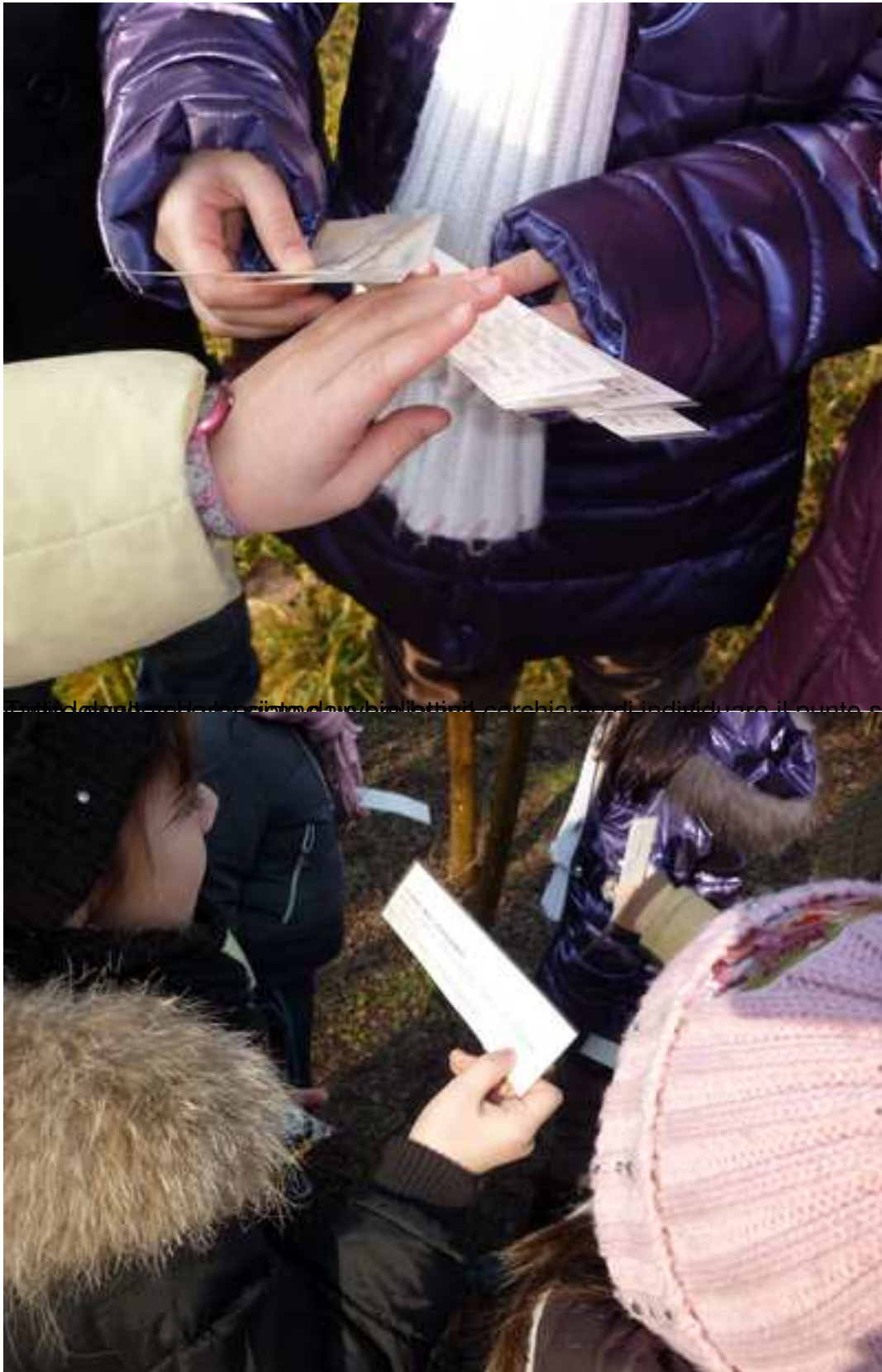
Le mappe della foresta sono state distribuite ai bambini per aiutarli a individuare il punto sulla mappa per