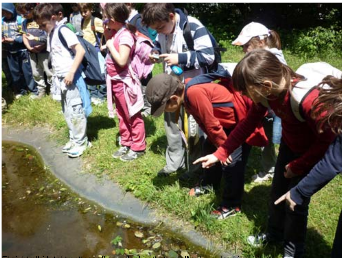
È caduta l'arbuta che attendiamo da questa estate. Le poche arbuti rimangono a cancelli per