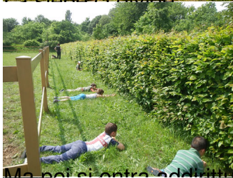
Ma poi si entra addirittura dentro!