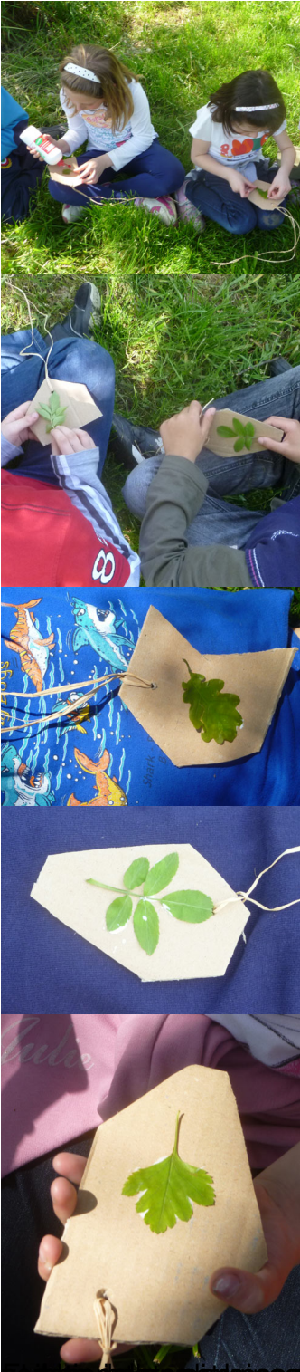
ve un ne dia a to os pa se dia s i a s i a m o r d e v e s a b e e r e d a e p p i a n e l i d i r a i s u a q u a d i t à e c c i u m e l t i m e n t o i n c h e