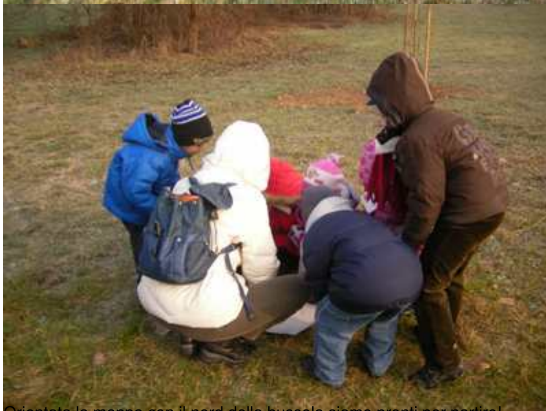
Orientata la mappa con il nord della bussola siamo pronti per partire!