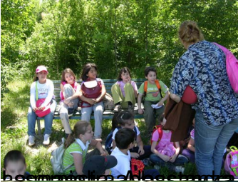
Ma che bimbi hanno fatto piano sul gas appodotto! Direi che