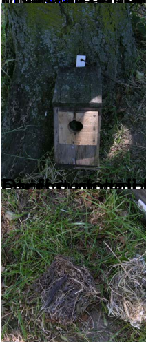
Ma che bimbi hanno fatto piano sul gas appodotto! Direi che