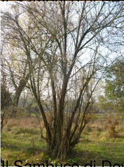
Il Sambuco di Deva e Greta: