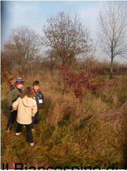
Il Biancospino di Iaria e Martina: