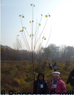
Il Sambuco di Giulia ed Eleonora: