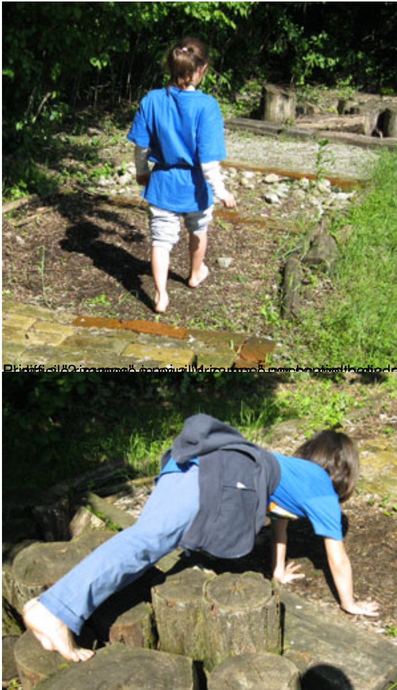
Più difficili il 2° e il 3° movimento. L'attività è stata svolta con bambini che hanno difficoltà di coordinazione con mani e piedi.