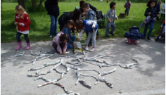
Il posizionamento degli occhi ...