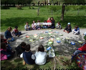
... giocare, stando attenti a non toccare rami e occhi!