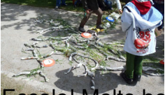
Eccole! Molto belle!